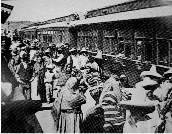
FIGURA 2. Estación de ferrocarril de Ario de Rosales (Boehm de Lameiras 1995, 114).

Tales conflictos y los originados por el movimiento de la Revolución en la entidad, incluyendo los que ocasionó el famoso bandolero Inés Chávez, quien en varias ocasiones asaltó e incendió trenes y otras pertenencias de la compañía de los Slade, mostraron los primeros indicios de pérdidas en la Compañía Industrial de Michoacán S. A. Sin embargo, unos años más tarde, en 1921, la misma compañía recobraría impulso al fusionarse con la Compañía del Ferrocarril Central de Michoacán S. A. para trabajar en la construcción de ferrocarriles, la explotación de terrenos petrolíferos, la explotación de bosques y el trabajo de la madera. Un año más tarde, no conforme con los predios adquiridos o arrendados hasta estas fechas, el mismo Slade compró tres predios en Zirahuén, por un costo de $1,500.00. 18