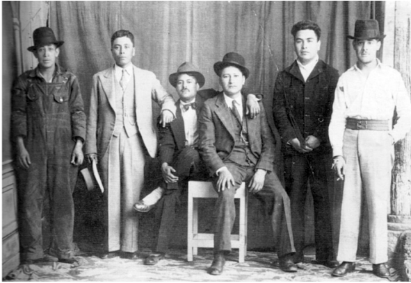
FIGURA 6. Personal de la locomotora de Zatzio, 1935-1937 (Hurtado 2010, 71).