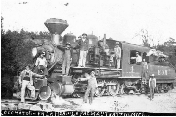
FIGURA 3. Locomotora en la hacienda La Palma, Zatzio, Mich., 1940 (Hurtado 2010, 68).

trabajo consistía en el corte de árboles para producir madera en diferentes medidas para su comercialización, como el pino rizado y pinoteca, en condiciones de trozas o tablas. La venta de esta madera le permitió a la compañía adquirir un prestigio importante como comercializadora de una de las maderas más limpias de nudos en todo el estado. 23