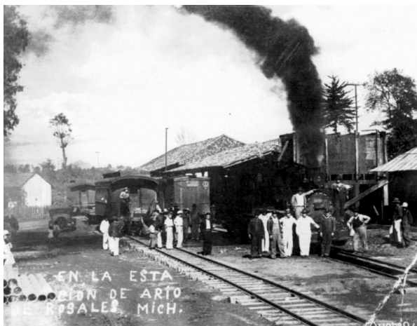
FIGURA 1. Ferrocarril que pasaba por Ario de Rosales, 1935 (Hurtado 2009, 69).