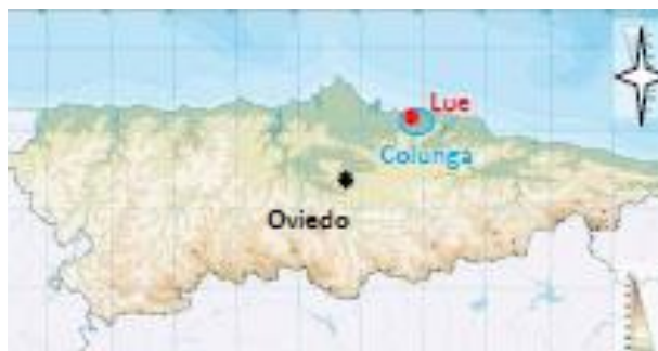
Fig. 1. Situación geográfica de Lue. En la costa oriental de Asturias.

Ello a su vez revertirá en un objetivo didáctico, que será el poder dar a conocer los resultados de este estudio mediante la divulgación científica. Por último gracias a todo ello se pretende de este modo enriquecer culturalmente la zona oriental asturiana, incorporando en las rutas turísticas de esta zona costera (Villaviciosa, Lastres, Colunga y Llanes), la posibilidad de visitar este yacimiento arqueológico. Se incluiría en la promoción la propia oficina de turismo de la zona, así como sería necesario elaborar un panel explicativo en la zona del emplazamiento (LLANO, 1928), conocido como “puente romano”, aunque como decimos, el actual, tenga características medievales.