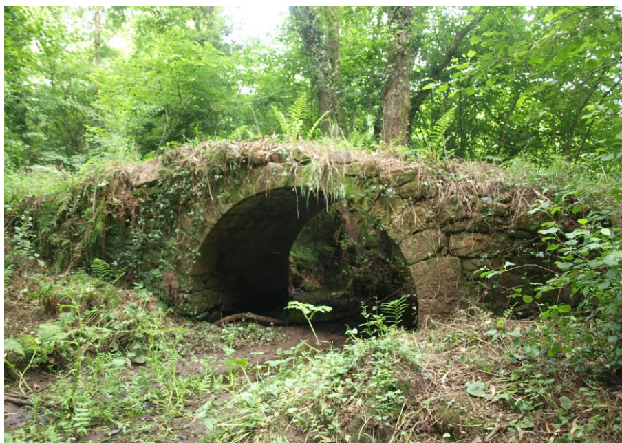
Fig. 2. Aspecto actual del puente de la Llomba. Lue.

Ello a su vez revertirá en un objetivo didáctico, que será el poder dar a conocer los resultados de este estudio mediante la divulgación científica. Por último gracias a todo ello se pretende de este modo enriquecer culturalmente la zona oriental asturiana, incorporando en las rutas turísticas de esta zona costera (Villaviciosa, Lastres, Colunga y Llanes), la posibilidad de visitar este yacimiento arqueológico. Se incluiría en la promoción la propia oficina de turismo de la zona, así como sería necesario elaborar un panel explicativo en la zona del emplazamiento (LLANO, 1928), conocido como “puente romano”, aunque como decimos, el actual, tenga características medievales.