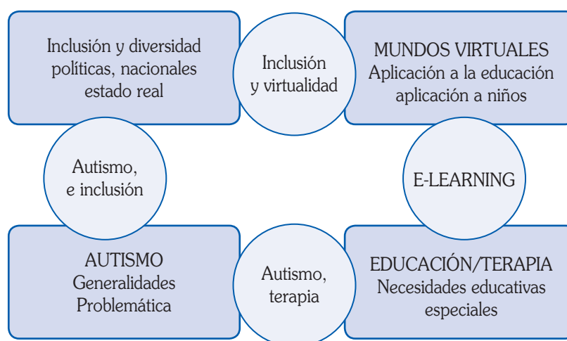
FIGURA Nº 2. Pilares del Escenario Formativo

Se logran leyes y políticas nacionales e internacionales las cuales han asignado fondos para la atención y apoyo psicopedagógico de las familias y niños autistas. Se expone la necesidad de lograr un apoyo no solo en la etapa de la infancia de los niños autista sino de todo el ciclo vital.