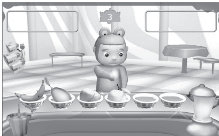
FIGURA N° 4. “Smoothies Hut”: primera actividad terapéutica de la plataforma