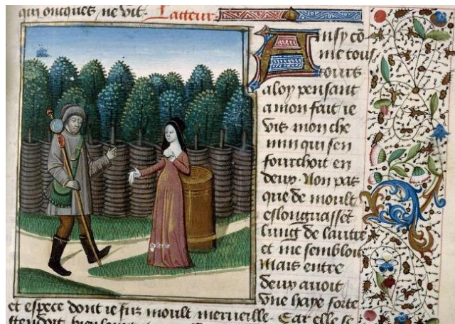
Figura 2: El Peregrino ante Ociosidad en el camino que se bifurca , en Digulleville, Pèlerinage de Vie humaine (Ms. 0208, Bibliothèque Municipale de Soisson, Francia).