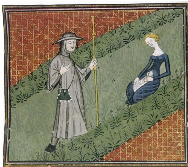
Figura 3: El Peregrino con Ociosidad , en Digulleville, Pèlerinage de Vie humaine (Ms. 1130, Bibliothèque Sainte-Genviève de Paris, Francia)

viene a completar el texto, interpretándolo. Así sucede por ejemplo, en el manuscrito que hoy se conserva en la Bibliothèque Municipale de Soisson (Francia), donde se representa este encuentro del protagonista con Ociosidad al inicio del camino que se bifurca: ella no solo tiene una mano en el pecho, sino que muestra este por encima de sus vestidos (Figura 2). Otros artistas iluminadores prefieren representarla jugando con un corderito (Figura 3). También se representa a Ocupación, desarrollando diferentes tareas (Figura 4). Puede verse una selección de las diferentes ilustraciones que presentan tanto los manuscritos como los impresos que transmiten la obra de Digulleville en diferentes lenguas en Herrán Alonso (2013, 182-196). Amblard (1998) reproduce en su estudio numerosas miniaturas del manuscrito de 1130 de la Bibliothèque Sainte-Geneviève de París. Delaisse (1956) estudió las de un ejemplar de la Bibliothèque royale de Bruxelles; del manuscrito 845 de la Bibliothèque Municipale d'Arras se han ocupado Fréger y Legaré (2008) y Soppelsa (2004) ofrece un estudio de conjunto de tres manuscritos franceses.