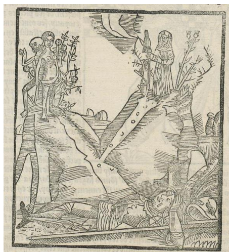
Figura 1: Sebastien Brant, La Nef des fols du monde , Lyon, G. Balsarin, 1499.

Por ejemplo, en lo que a la literatura respecta, el bivium no puede estar ausente de la Nave de los locos (Basilea, Johann Bergmann de Olpe, 1494) 8 de Sébastien Brant, cuando, dominado por la certidumbre de que las calamidades de los hombres provienen de sus pecados, el autor se propone mostrar en tono satírico y burlón que no logra, con todo, borrar el espíritu pesimista que anima al conjunto, el horror de los vicios, a través de un verdadero inventario de todas las locuras con que estos conducen al hombre a su pérdida. Ofrece así la obra una galería de retratos marcados por el orgullo, el fraude, la usura, la testarudez, entre otros muchos de los que conforman el desfile macabro de las debilidades humanas. El centenar largo de cuadros que componen el relato aparece, desde la primera edición, conformado por el conjunto de texto e imagen 9 , al completarse el poema con un grabado que sirve para poner en escena la locura humana y la manera en que las aberraciones engañosas de los sentidos conducen al hombre a la perdición. Hacia el final de la obra, un grabado retoma el tema del camino que se bifurca y del hombre ante la disyuntiva: mientras a la derecha, en lo alto de una colina y rodeado de cardos y espinas, espera la virtud al final de un camino pedregoso, simbolizada por el trabajo, en el lado opuesto, y al final de un camino más recto y despejado, espera el vicio, simbolizado por una joven desnuda rodeada de rosas, detrás de la cual asoma la misma muerte (Figura 1).