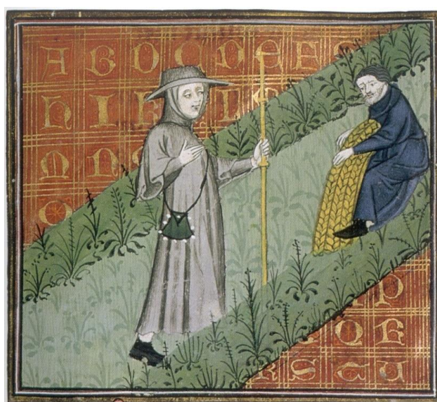
Figura 4: El Peregrino con Ocupación , en Digulleville, Pèlerinage de Vie humaine (Ms. 1130, Bibliothèque Sainte-Genviève de Paris, Francia)

Yo soy aquel que a todo el mundo da de comer después que salió vuestro padre del Paraíso. Yo hago pasar el tiempo presto y con alegría, y por buen derecho a mí me llaman Ocupación, o Trabajo, si más te place nombrarme. Y por aquí pasan los que a la santa cibdad quieren ir, a la cual según tus palabras desea venir. Tú harás lo que querrás y, si te place, vendrás por aquí. Toma este camino, no lo dexes, ca es sin duda derecho y te guardará de grandes inconveniente (Capítulo IV, Libro II, f. 51r).