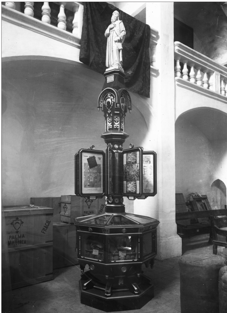
Fig. 4 Vista completa de la vitrina en el moment del muntatge. Permet observar les cavitats, marcs i el remat amb la figura de Ramon Llull, obra de Llorenç Ferrer. Fons fotogràfic Virenque SAL-CPV-1191