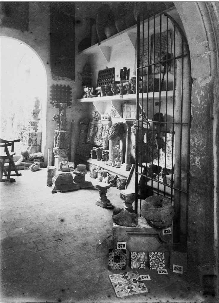
Ciutat de Mallorca. sala baixa del Col·legi de la Sapiència.