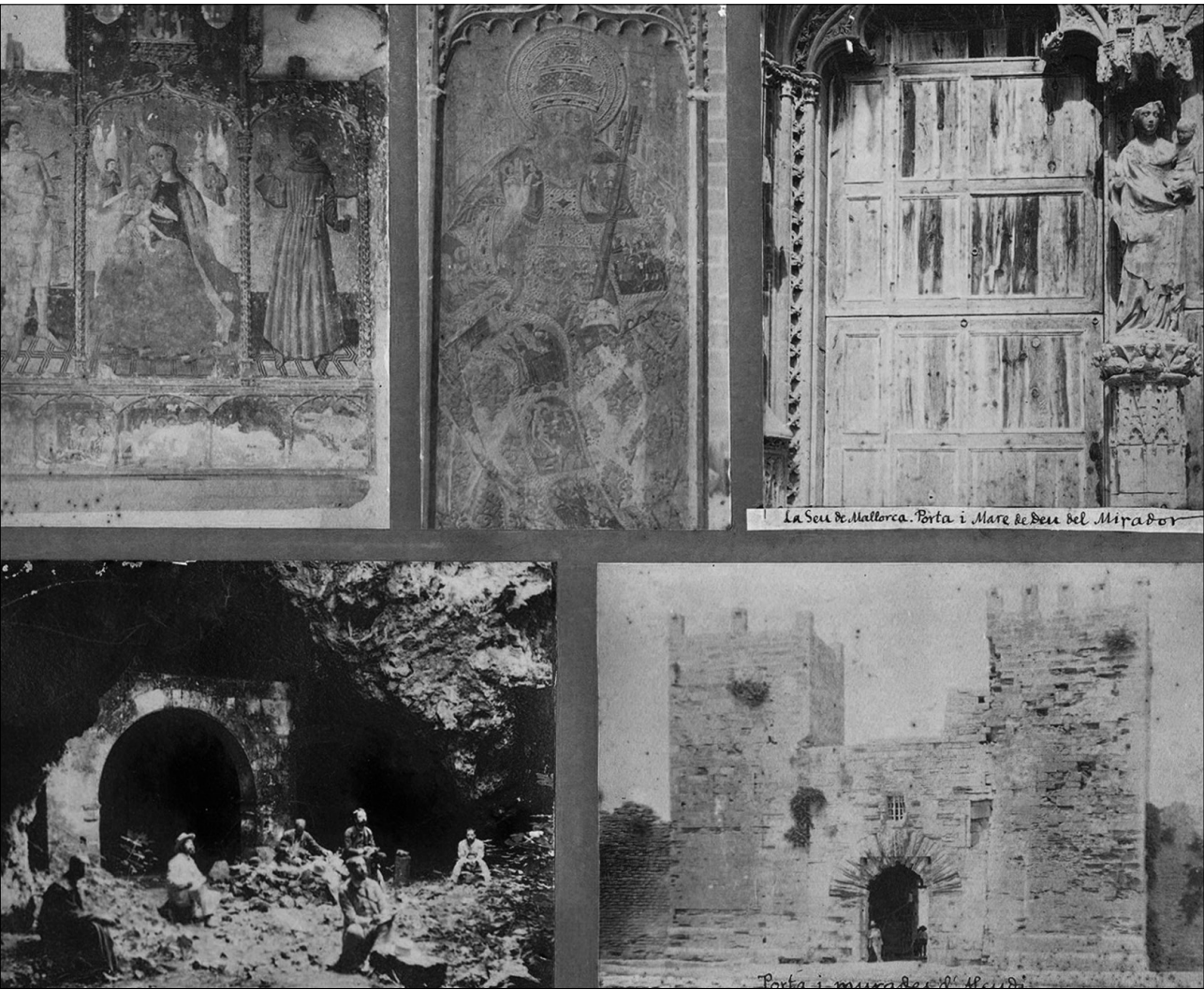
Fig. 3 Grup de fotografies de la visita realitzada a Alcúdia i una de la porta del Mirador de la Seu. Avui en dia conserven el muntatge original.