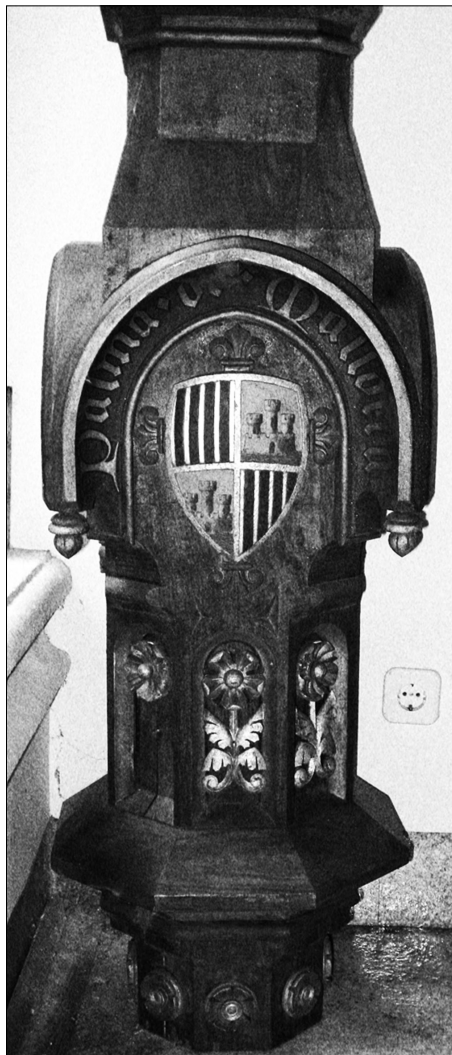
Fig. 2 Columna central de la vitrina on hi havia els escuts de la ciutat de Palma i el de la Societat Arqueològica Lul·liana. Construïda per Jaume Portell i pintada per Pere Llorens. Es conserva a la sala de conferències de la SAL. Autor: Carme Colom Arenas