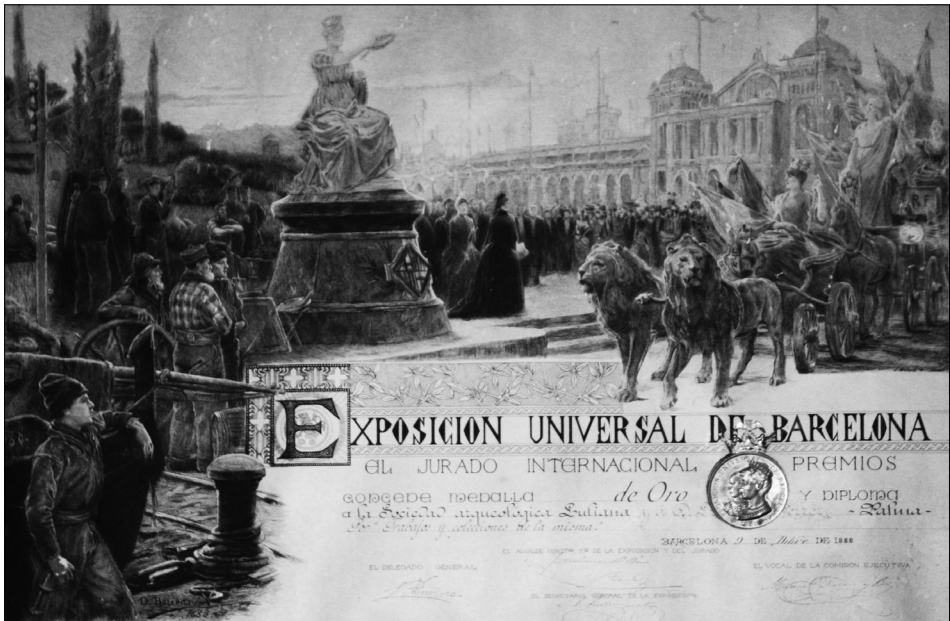
Fig. 7 Diploma acreditatiu i medalla de la participació de la Societat a l'Exposició Universal de Barcelona. Autor: Dionís Baixeras.