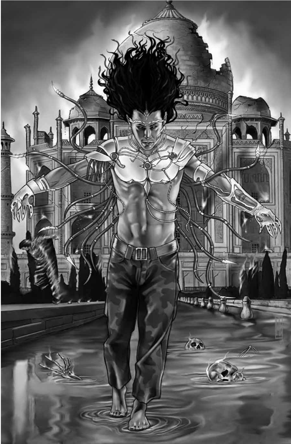
▪ Supergod , 2011 | Warren Ellis, Garry Gastonny | Avatar Press