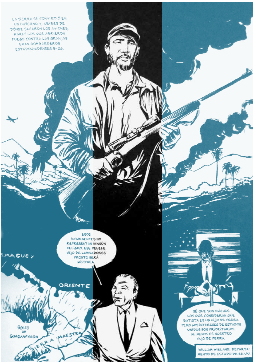
▪ Castro, 2011 | Reinhard Kleist | S.A. Norma Editorial