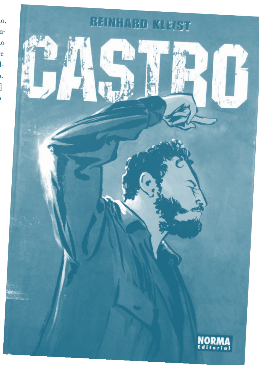
■ Castro, 2011 | Reinhard Kleist | S.A. Norma Editorial

[...] a comienzos de los 80 se realizaron estudios pioneros sobre los efectos reproductivos de población expuesta a plaguicidas en la floricultura. El primero de ellos fue una encuesta a 8.867 trabajadores (2.951 hombres y 5.916 mujeres) en la que se indagó sobre abortos espontáneos, prematuridad, mortinatos y malformaciones congénitas (Restrepo et al. , 1990). Los hallazgos mostraron varias asociaciones entre los eventos reproductivos adversos y el trabajo en la floricultura (Ministerio del Ambiente, 2012: 283).