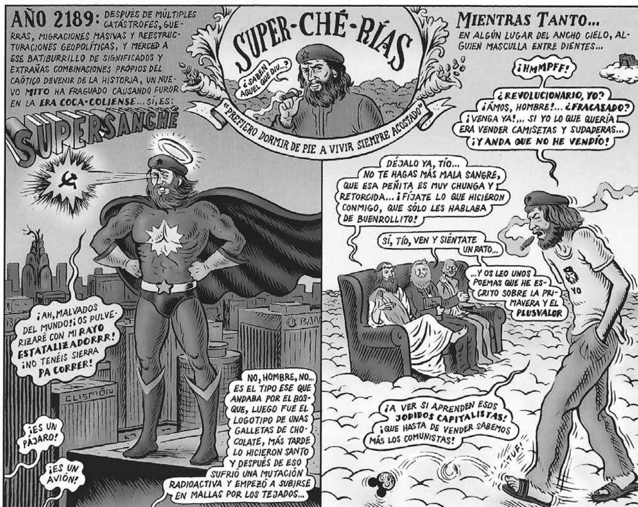
El otro mundo, 2009 | Miguel Brieva | Random House Mondadori S.A.

ción conocimientos que ensayaron en la agroindustria, y recrean de manera creativa en sus propios cultivos orgánicos (formas aéreas de cultivo para no agacharse).