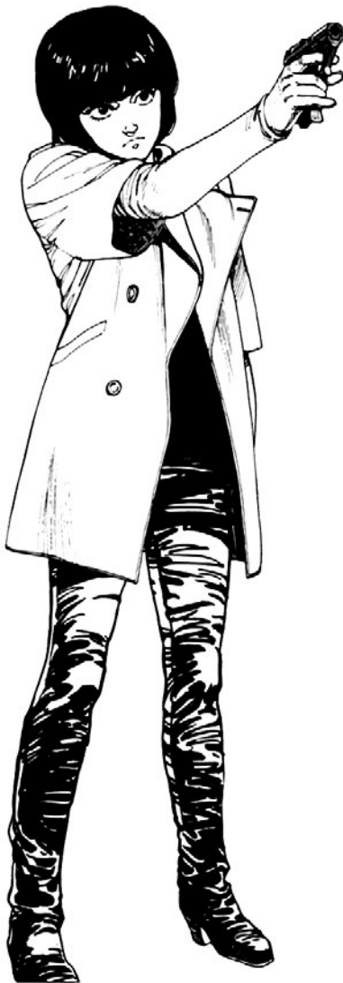
▪ Akira, 1986 | Katsuhiro Otomo | Glénat Editions S.A.