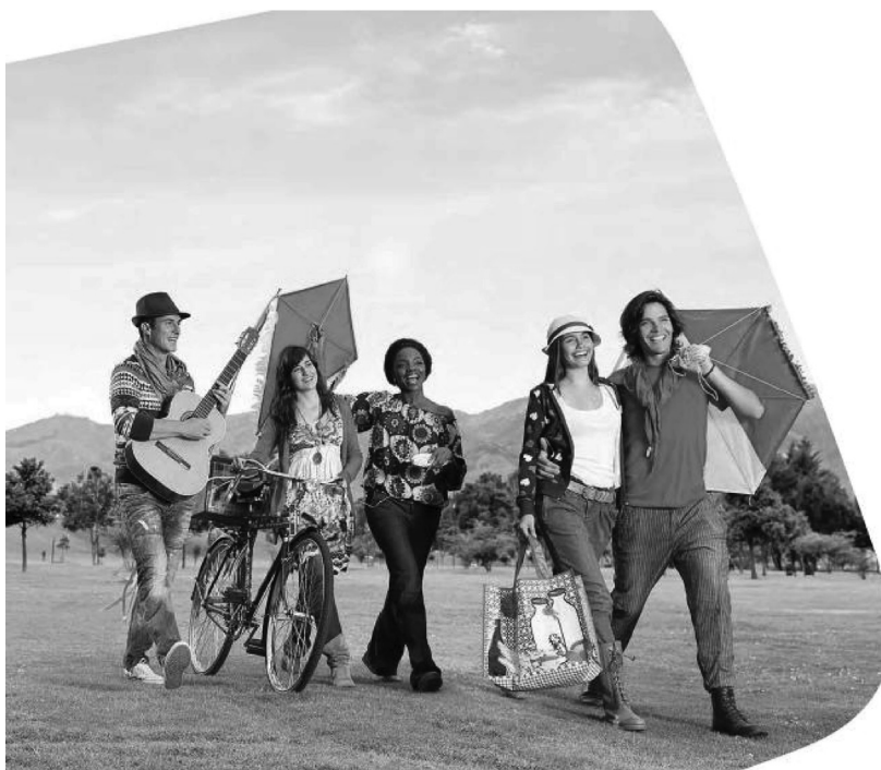
Figura 1. Ejemplo de imágenes