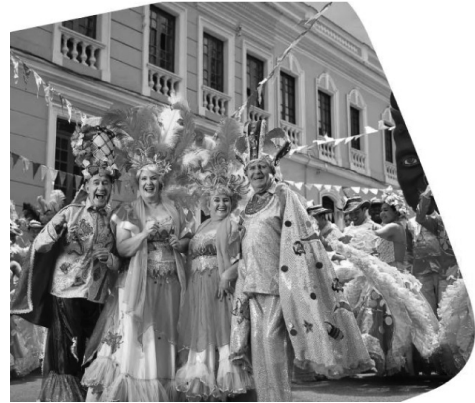
Fuente: Bancolombia (2011). Informe Gestión Empresarial Responsabilidad Corporativa , pp. 78-79.

A continuación, el informe presenta un relato construido a partir de imágenes que ilustran algunos de los valores que son la base para una banca más humana, pero en las que son notorios la construcción del encuadre y los escenarios que en su mayoría retratan situaciones simples demasiado perfectas en las que el aspecto fotográfico bien logrado, resalta la intención por destacar un conjunto de ideales; como en la imagen de una recién nacida dormida con un brazalete con el nombre de Esperanza que guarda una relación directa con el texto escrito acerca del “ Respeto por los inversionistas ”.