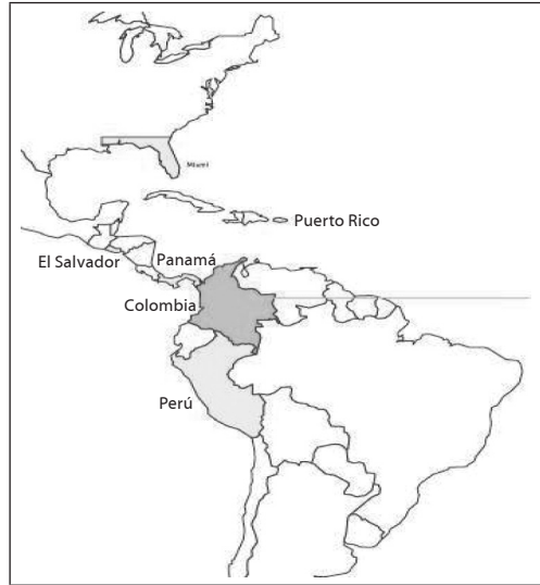
Fuente: Bancolombia (2011). Informe Gestión Empresarial Responsabilidad Corporativa , pp. 4-5.

promiso, confianza, conversar, crecimiento, eficiencia, gratitud, honradez, humildad, inclusión, innovación, rentabilidad, respeto, sostenibilidad y transformación). En este caso, esta estrategia se convierte en eslogan de una campaña publicitaria, que en esta imagen ( collage ) retoma recortes de periódico que intentan mostrar el reconocimiento público que obtuvo la iniciativa. En esta imagen, la mayoría de los recortes no tiene fecha de publicación y en el uso, hay una contradicción pues en los recortes se hace énfasis en datos estadísticos y la emisión de valores intenta resaltar un rostro más humano de la banca. Lo anterior expresa la dificultad de humanizar tales propósitos y la actividad económica de este tipo de organizaciones.