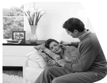
Fuente: Bancolombia (2011). Informe Gestión Empresarial Responsabilidad Corporativa , pp. 84-85, 110-111.