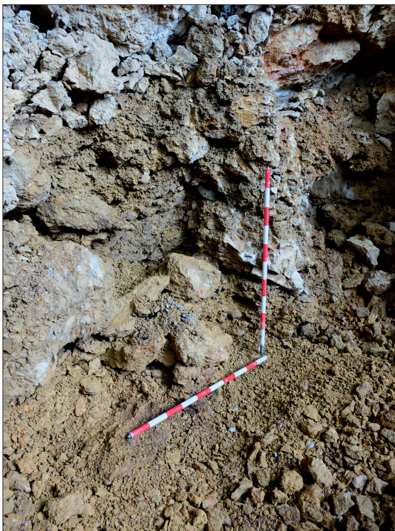
Figura 2. Aspecto de la zona del depósito tras su limpieza.

cerámica se realizó a una cota de -60/-72 cm y se recuperó en dos conjuntos. El superior, que dio luz al descubrimiento, reposaba sobre cuatro bloques calcáreos inestables; varios fragmentos estaban pulverizados y seccionados por el impacto de la maquinaria empleada para la remoción de tierras. El inferior, no visible inicialmente y que apareció bajo los citados bloques, ofrecía varios fragmentos en conexión sobre un nuevo lecho de clastos de menor tamaño. Retirados estos, se profundizó todavía hasta la cota -1,15 para certificar que no existían más fragmentos o restos de nivel arqueológico (fig. 2). En el transcurso de la intervención se recuperaron también varios fragmentos óseos de aspecto subactual, que se recogieron selectivamente, pues resultaban relativamente abundantes en toda la zona removida. La cerámica se hallaba impregnada de humedad, resultando en algunos casos una masa de barro negruzco imposible de recuperar.