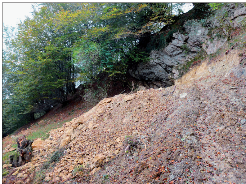
Figura 1. Cueva de Ulizar con escombrera de la remoción mecánica.

En la base de la visera rocosa se conservaba una acumulación de derrubios seccionados por los trabajos de desmonte con una potencia de 1,20 m. Ofrecían un aspecto caótico, con bloques de distintos tamaños en disposición anárquica, inestables, con abundantes huecos entres ellos y un sedimento arcilloso amarillento muy plástico. En la parte inferior de dicho corte se apreciaban varios fragmentos de cerámica de aspecto negruzco que parecían corresponder a un mismo recipiente.