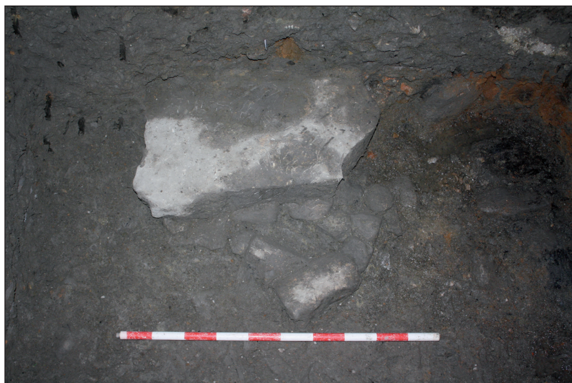
Figura 5. Detalle de la tumba 2 con la losa de cubierta, vista desde el suroeste.