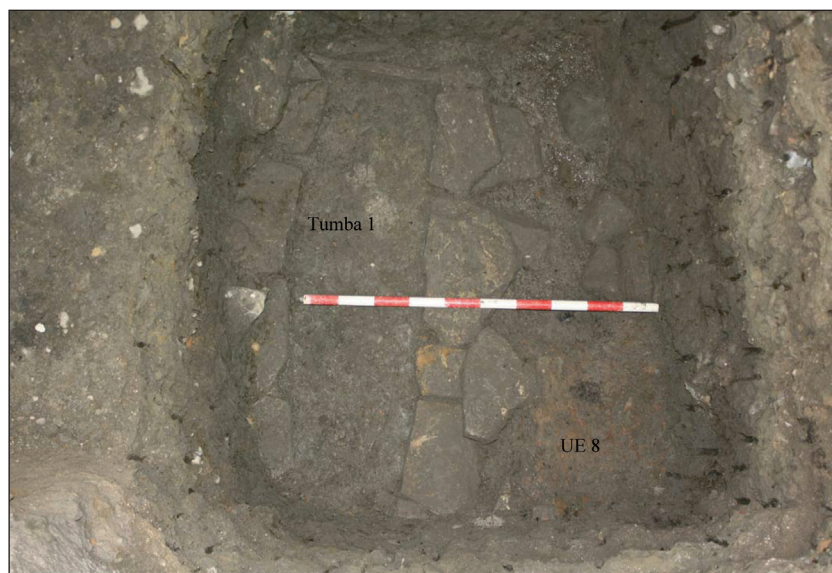
Figura 3. Inclusión de la cista de la tumba 1 en el estrato UE 8, vista desde el este.

En cuanto a los estratos de la fase altoimperial, la UE 9 se asocia a una ocupación residual que cubre una pequeña área dedicada a combustiones, en el margen este del foso, definida por varios troncos carbonizados bajo una amalgama de bloques y ladrillos de adobe y arcillas rubefactadas (UU. EE. 8 y 14).