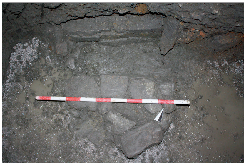
Figura 6. Tumba 2, vista desde el suroeste.

En cuanto a los materiales, se han recuperado un total de 118 piezas con 30 fragmentos cerámicos, 38 restos de adobe, 2 de vidrio, 43 restos óseos, 4 líticos y una escoria de hierro. Un total de 23 se recogen en el depósito revuelto superficial, 27 en los estratos altoimperiales, 67 en los depósitos que rellenan los enterramientos, 1 en la estructura de la tumba 2 y otro bajo la cabecera de la tumba 1.