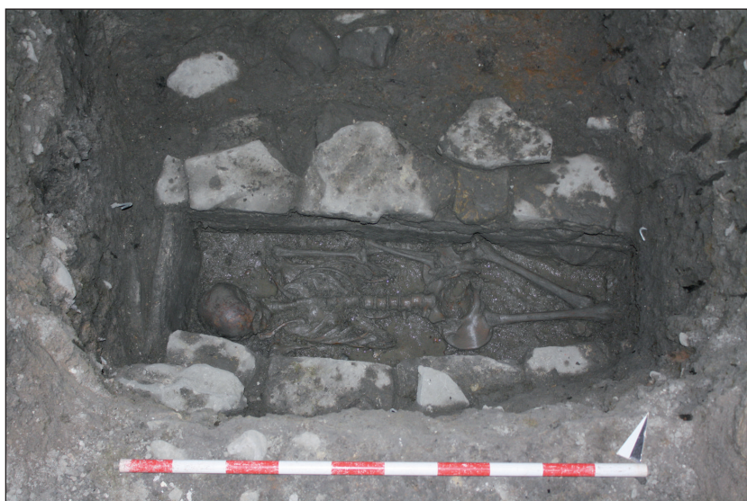
Figura 4. Tumba 1, vista desde el suroeste.

La tumba 1, a una cota ligeramente superior, tiene una fosa de 1,75 x 0,90 metros y un espacio sepulcral trapezoidal de 1,67 metros de longitud, 0,30 metros de alzado y 0,25 metros de anchura en los pies y 0,42 metros en la cabecera. Su estructura la conforman dos muretes de mampostería y lajas hincadas en la cabecera y los pies, utilizándose únicamente tierra para su cubrición. Aloja la inhumación en conexión anatómica de una mujer joven, decubito supino , con los brazos estirados y la cabeza ladeada hacia la derecha y sin ningún ajuar personal.