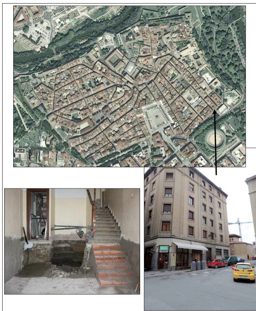
Figura 1. Situación del edificio en rehabilitación, calle Labrit n.º 33 y detalle del foso para el ascensor durante las obras.

Entre las calles Compañía y Merced discurre un barranco, utilizado como vertedero en época altoimperial según ha publicado M. a Á. Mezquíriz (1997-1998: 52) y que ha sido recientemente interpretado (Unzu y Barberena, 2013) como la divisoria entre la zona urbana y un amplio espacio artesanal periurbano que se extiende al sur y oeste del mismo, con evidencias de diversos talleres alfareros, guarnicioneros, óseos o metálicos en Calderería, San Agustín o la plaza del Castillo, con cronologías entre los siglos I y III d. C. Esta ampliación de los límites de la ciudad conlleva su propuesta de la correspondencia del portal medieval de Tejería con el actual acceso a la calle Estafeta.