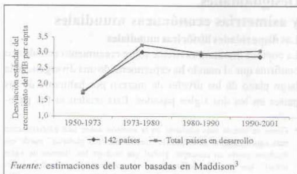
Figura 2. Dispersión de las tasas de crecimiento de los países en desarrollo.

El análisis de la misma fuente de datos revela otro fenómeno igualmente importante: la marcada y creciente dispersión de los ritmos de crecimiento de los países en desarrollo durante el último cuarto del siglo XX, es decir, la coexistencia de “ganadores” y “perdedores” en cada agrupación de países. De hecho, para la misma muestra de 142 países, la desviación estándar de los ritmos de crecimiento por habitante aumentó de 1,80 entre 1950 y 1973 a cerca de 3,00 desde 1973 (figura 2). Es importante destacar que este proceso es mucho más generalizado que la tendencia al incremento de las disparidades internacionales del producto por habitante, ya que afecta a todas las regiones y tanto a los países de ingresos bajos como de ingresos medios.