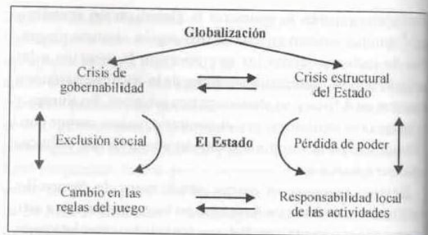
Figura 1. Crisis del Estado en la globalización