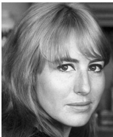
Cynthia Powell, primera esposa de John Lennon.