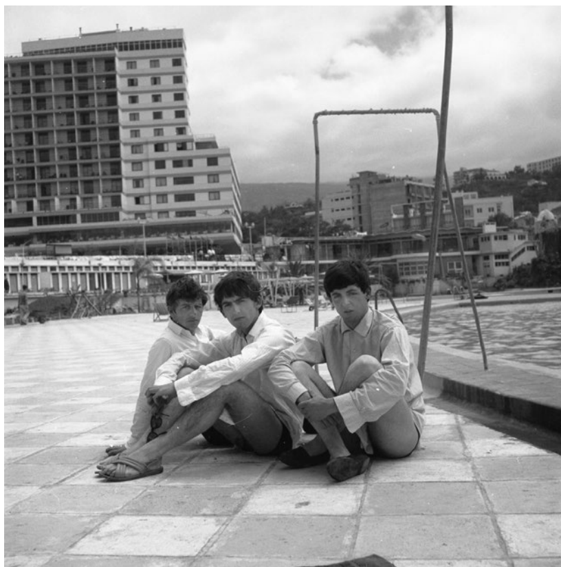
Los Beatles en Tenerife. Ringo, George y Paul

Esta presentación es la historia del nacimiento de los Beatles dentro del contexto de un viaje de Liverpool a Hamburgo: desde sus comienzos humildes en el Liverpool de la segunda guerra mundial hasta su visita a Hamburgo en agosto de 1960, la primera de las cinco que hicieron a la ciudad alemana. Cuatro meses después de su última visita a Hamburgo en diciembre de 1962, tres miembros del grupo, Paul McCartney, George Harrison y Ringo Starr, aterrizaron en el aeropuerto de Los Rodeos en Tenerife para pasar, casi desapercibidos, sus últimas vacaciones tranquilas antes de hacerse famosos.