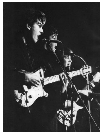
Los Beatles en Hamburgo. Arriba, en la primera fotografía, con Pete Best.