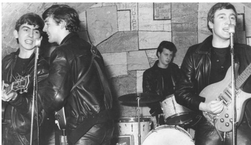
Los Beatles, con Pete Best.