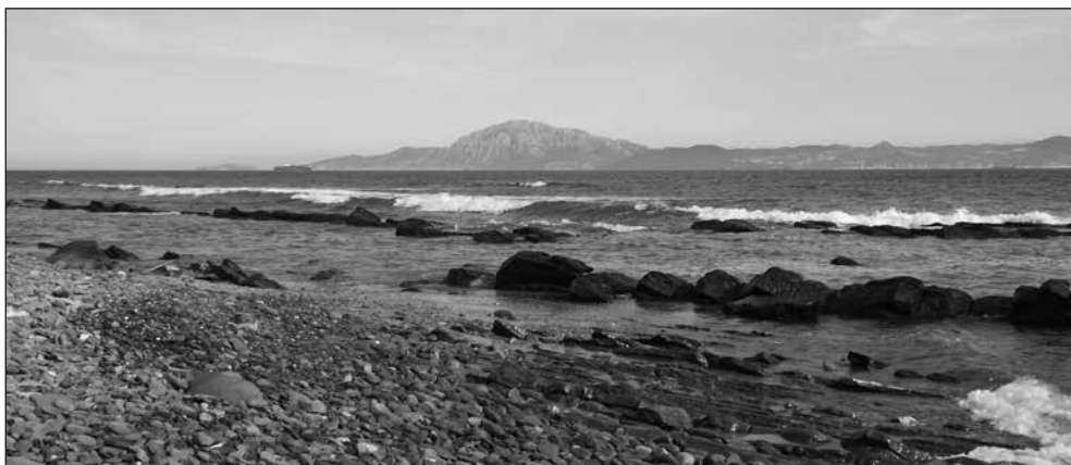
Fig. 1.- .Estrecho de Gibraltar visto desde la Colada de la Costa.