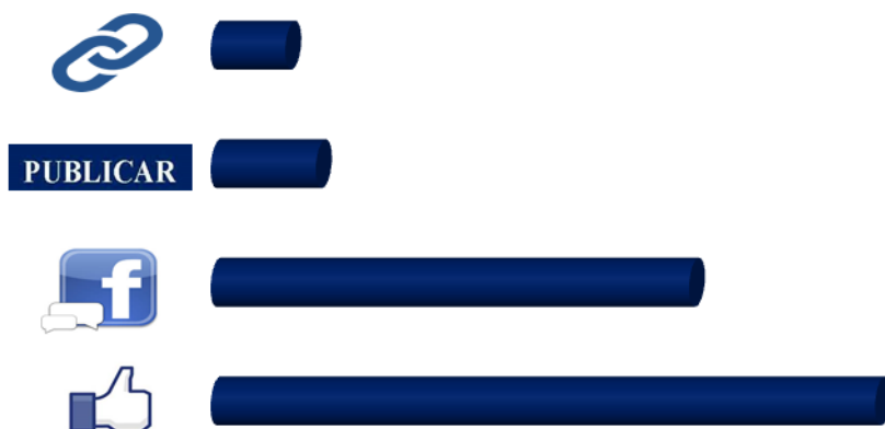
Figura 3. Intervención del alumnado

El muro del grupo fue utilizado como canal de información para compartir información –artículos, enlaces a documentales, noticias, etc.- sobre aquellos aspectos de la asignatura que suscitaban un mayor interés por parte del alumnado, como por ejemplo, las cuestiones relativas al crimen organizado, las alteraciones neurológicas en el caso de los delincuentes violentos o el tratamiento de los delincuentes sexuales. En muchas ocasiones observamos cómo, a los recursos publicados, los alumnos respondían con otros recursos que ellos encontraban.