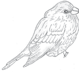
Detalle de Pájaro (2015). Técnica mixta: Cindy Gómez.