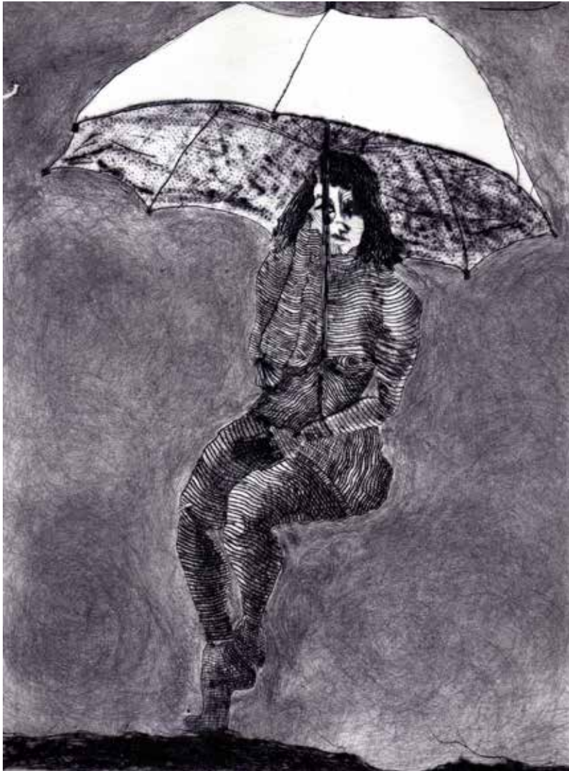
Agua (2005). Hecograbado sobre acrílico: Layla Cora.

Tenías tantas ideas sobre el espacio-tiempo; y suicidio fue un epílogo escrito un día antes de que el resultado nos tapara la boca.