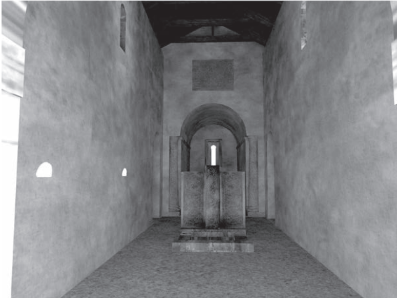
3. Reconstrucción de la basílica de Santa Cruz (siglo VIII). Exterior desde el noroeste (arriba); interior hacia el este (abajo).