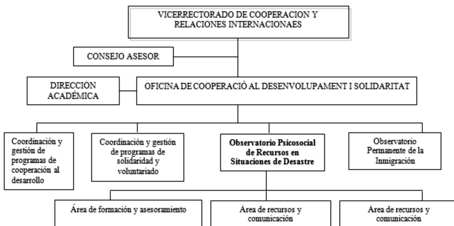
Figura 1. Organigrama

Este proyecto fue presentado al Vicerrectorado de Cooperación Internacional y Solidaridad de la propia Universidad. Los órganos de gobierno apostaron fuerte por el proyecto y, desde el año 2004, está en funcionamiento el Observatorio Psicosocial de Recursos en Situaciones de Desastre (OPSIDE). En la Figura 1 se muestra el organigrama.