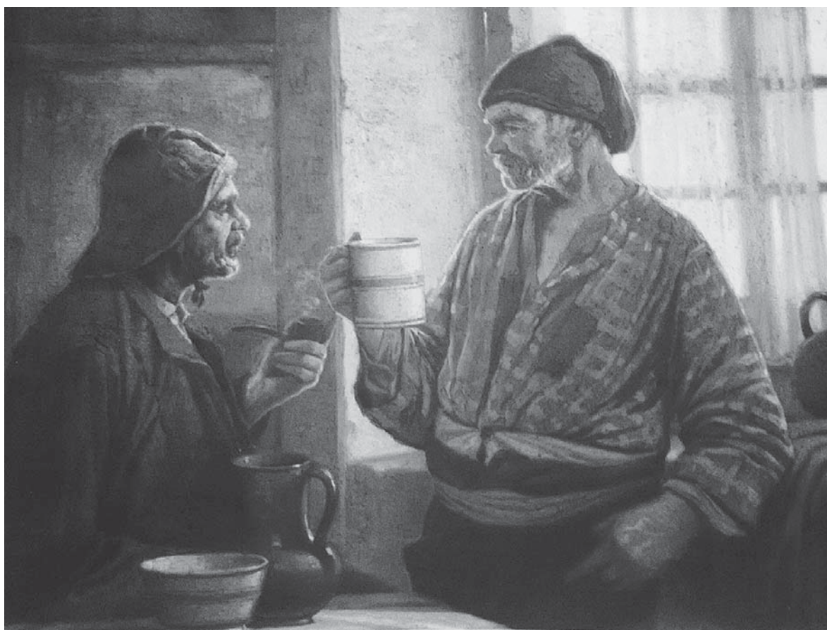
FIG. 5. Pescadores de Buarco.

Ramos, quien es reseñado por un lado como artista sensible y por otro como artista castizo y en esa dicotomía se movían sus obras Los del espíritu , vinculada a la primera corriente, y Flores del mal , partícipe de la segunda como también Errante y Margarita Gautier . De él también destacan su expresividad y el manejo del colorido 107 y el aporte que realizó con sus estampas románticas 108 .