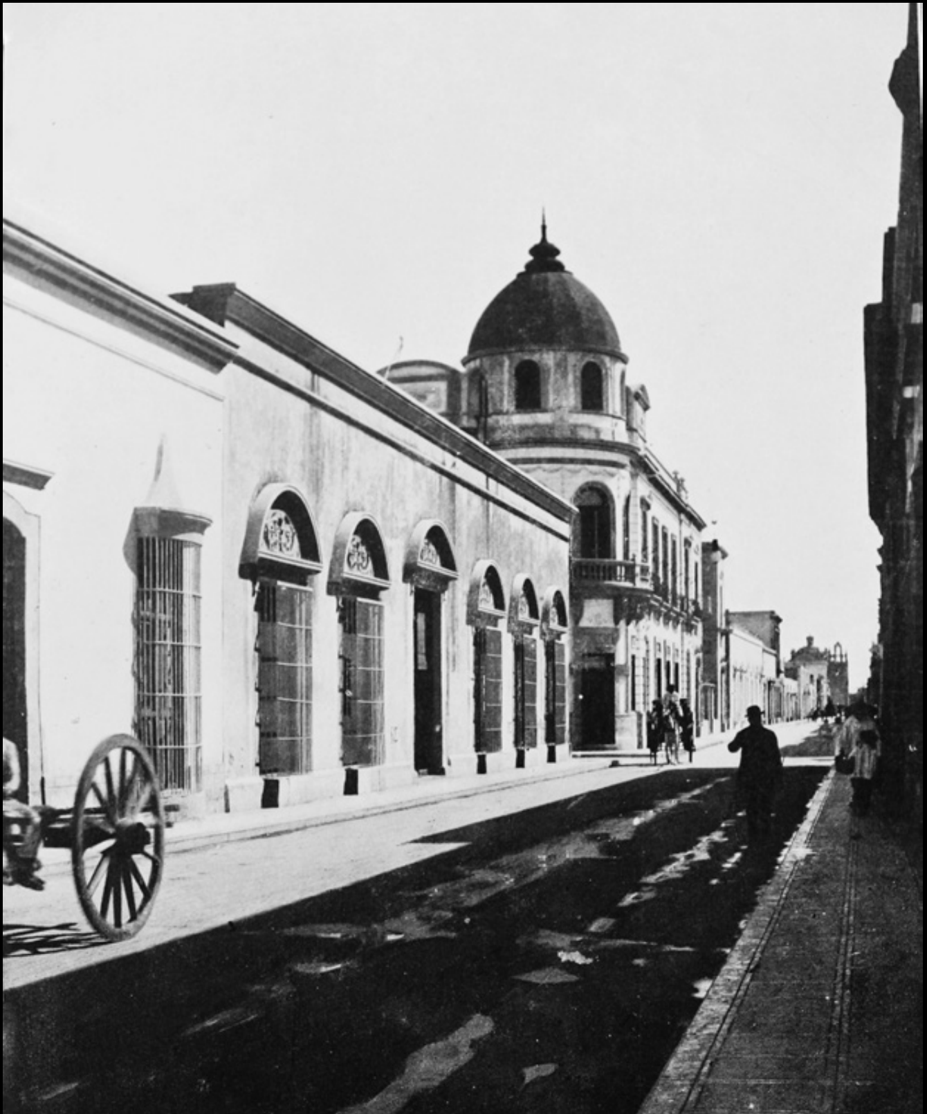
Vista de la actual calle 59, llamada en aquel entonces camino de Santiago, y posteriormente conocida como calle Porfirio Díaz. Destaca en la esquina, el edificio del Banco de México, demolido durante la década de 1970.