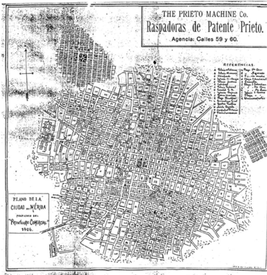
Imagen 5. Plano de la ciudad de 1906. En el se observa la conurbación de los poblados cercanos, así como la consolidación de nuevas calles y centros de servicios.

solicitud respectiva el plano por duplicado con todos los detalles y proporciones conforme a los cuales se verificará la construcción, [...]