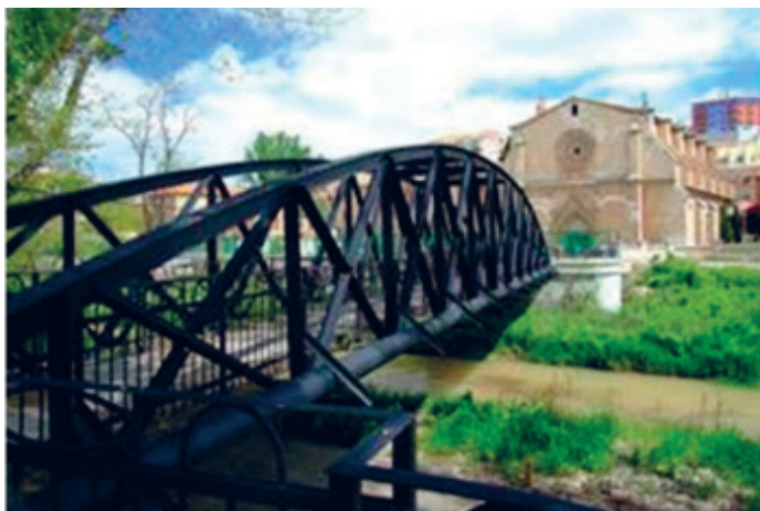
Figura 3. El puente de San Francisco hoy

otro preexistente. Se renovó en hierro en 1868, para ser volado durante la Batalla de Teruel en 1938, tras lo que se reconstruyó convertido en la pasarela peatonal que es hoy en día. En definitiva, la existencia y ubicación de este puente de San Francisco están perfectamente claras desde la perspectiva histórica y topográfica.