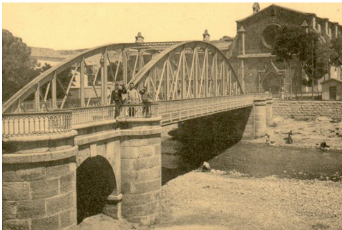
Figura 2. Puente de San Francisco antes de su voladura en la Guerra Civil