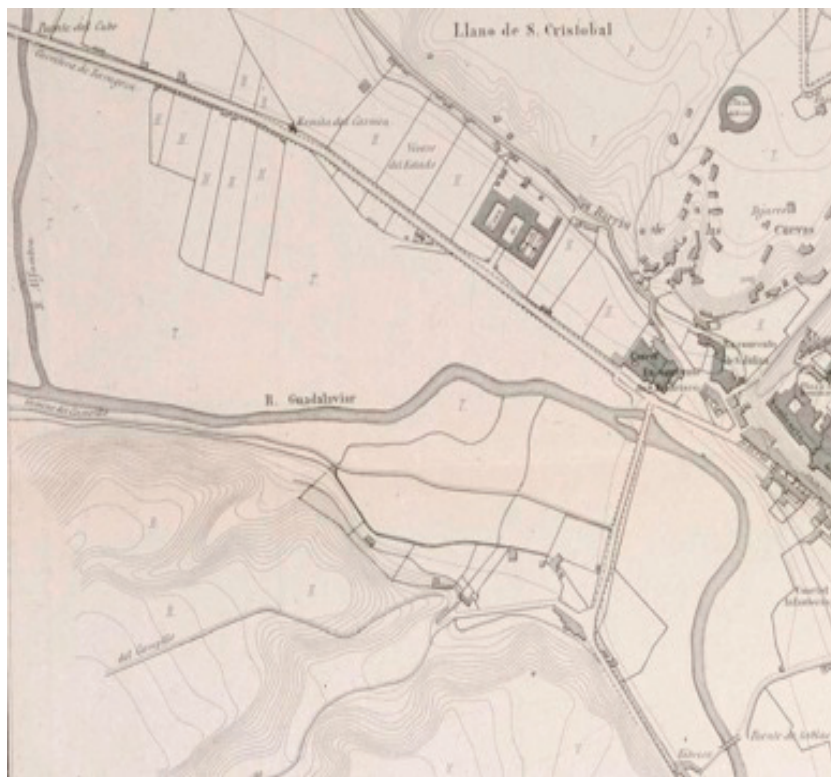
Figura 4. Detalle de un plano de Teruel de 1881 de la Biblioteca Nacional

En la figura siguiente, en la que se presenta un fragmento de un plano militar de la ciudad de Teruel de finales del siglo XIX, se observa la ubicación del puente del Cubo en la esquina superior izquierda, del puente de tablas (de Doña Elvira), en la esquina inferior derecha y del de San Francisco, a media altura en la zona derecha. Es de reseñar que se trata, además, de los únicos puentes de la ciudad (al margen de los Arcos) en esa época. Este mapa nos permite determinar de forma exacta la ubicación de los puentes sobre el terreno.