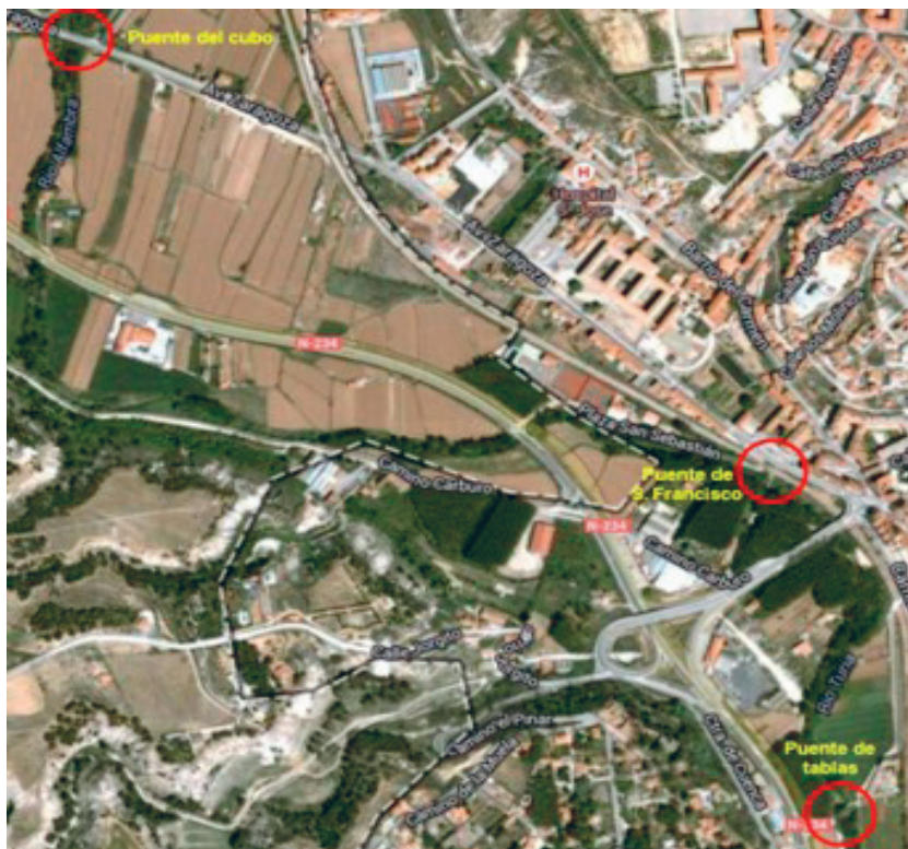
Figura 5. La misma zona de Teruel en la actualidad, con la ubicación de los puentes

para ubicar los puentes; puesto que sólo el del Cubo 14 (en la actual Avenida de Zaragoza) se encuentra en una vía principal.