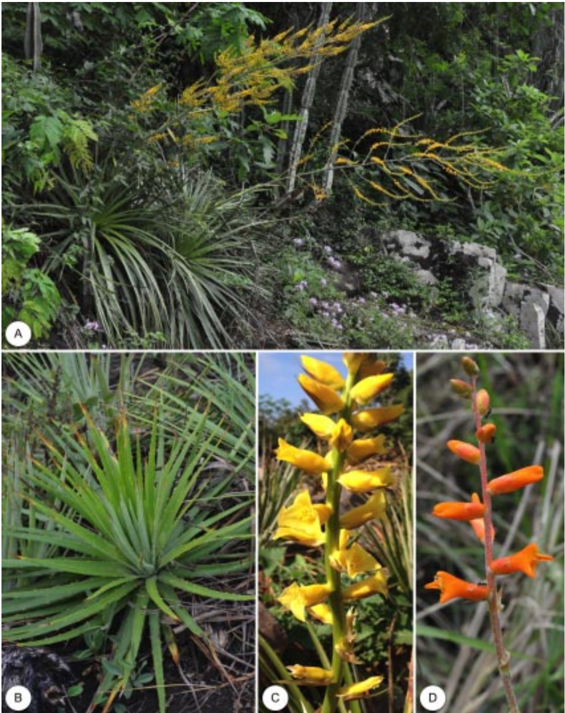
FIGURA 2 – A – Hábito de Dyckia selloa . B – Hábito vegetativo de Dyckia ibicuiensis . C – Detalhe da inflorescência de Dyckia ibicuiensis . D – Detalhe da inflorescência de Dyckia remotiflora .