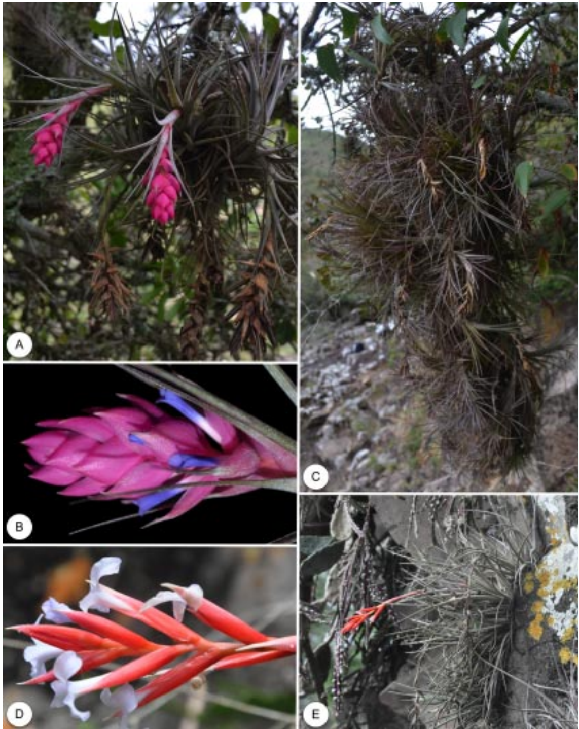
FIGURA 5 – A – Hábito de Tillandsia stricta . B – Detalhe da inflorescência de Tillandsia stricta . C – Hábito de Tillandsia tenuifolia . D – Detalhe da inflorescência de Tillandsia toropiensis . E – Hábito de Tillandsia toropiensis em escarpas rochosas às margens do rio Guassupi.