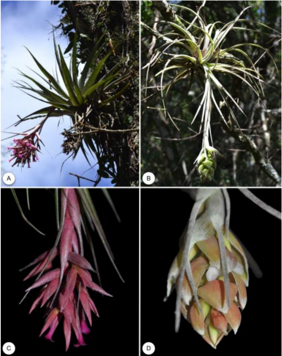
FIGURA 4 – A – Hábito de Tillandsia geminiflora . B – Hábito de Tillandsia pohliana . C – Detalhe da inflorescência de Tillandsia geminiflora . D – Detalhe da inflorescência de Tillandsia pohliana .