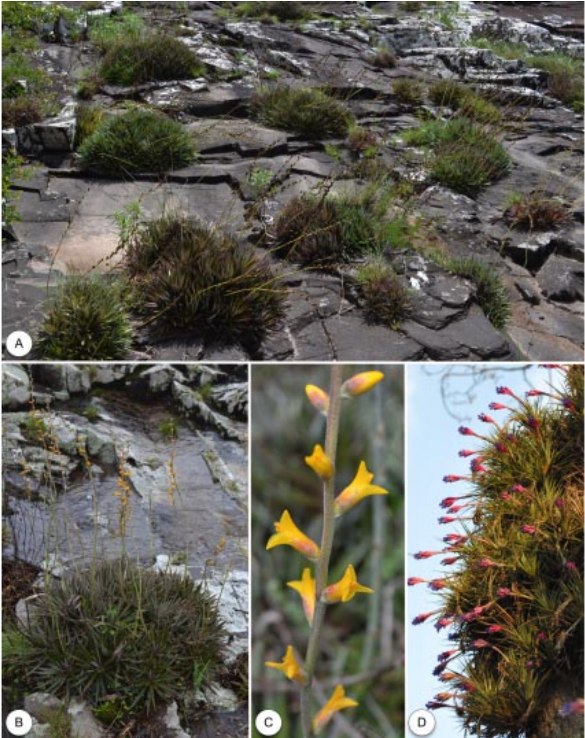
FIGURA 3 – A – Hábito e hábitat de Dyckia strehliana em afloramentos rochosos às margens do rio Toropi. B – Hábito de Dyckia strehliana . C – Detalhe da inflorescência de Dyckia strehliana . D – Hábito de Tillandsia aeranthos .