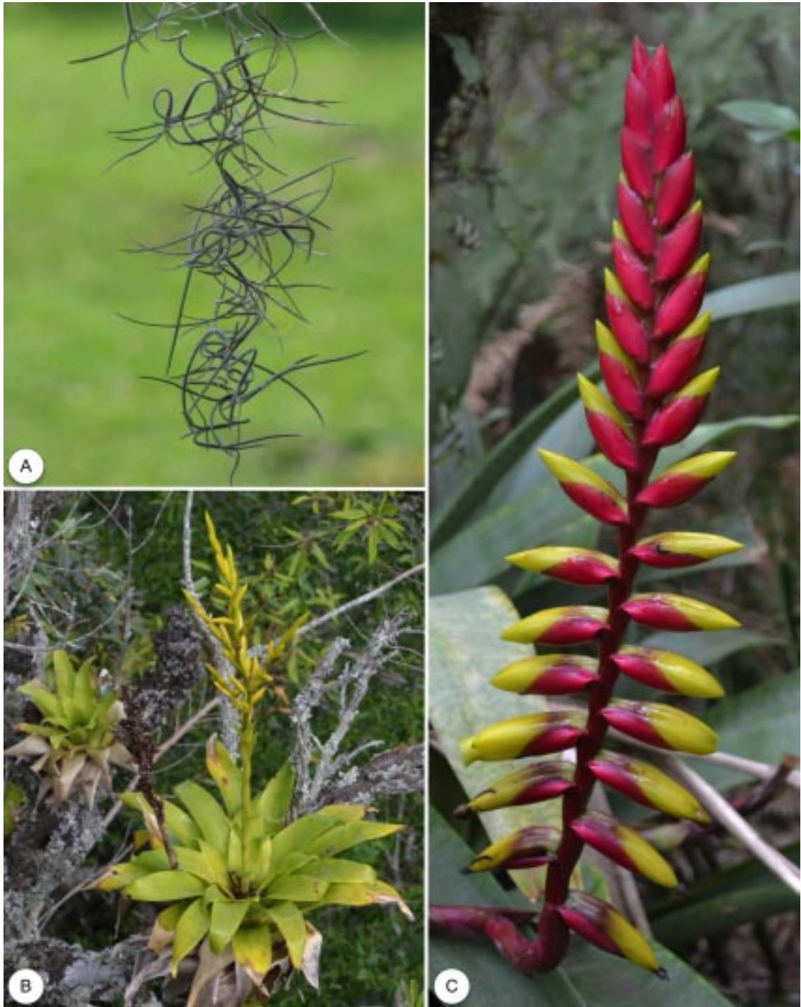
FIGURA 6 – A – Hábito vegetativo de Tillandsia usneoides . B – Hábito de Vriesea friburgensis var. tucumanensis . C – Detalhe da inflorescência de Vriesea platynema var. platynema .