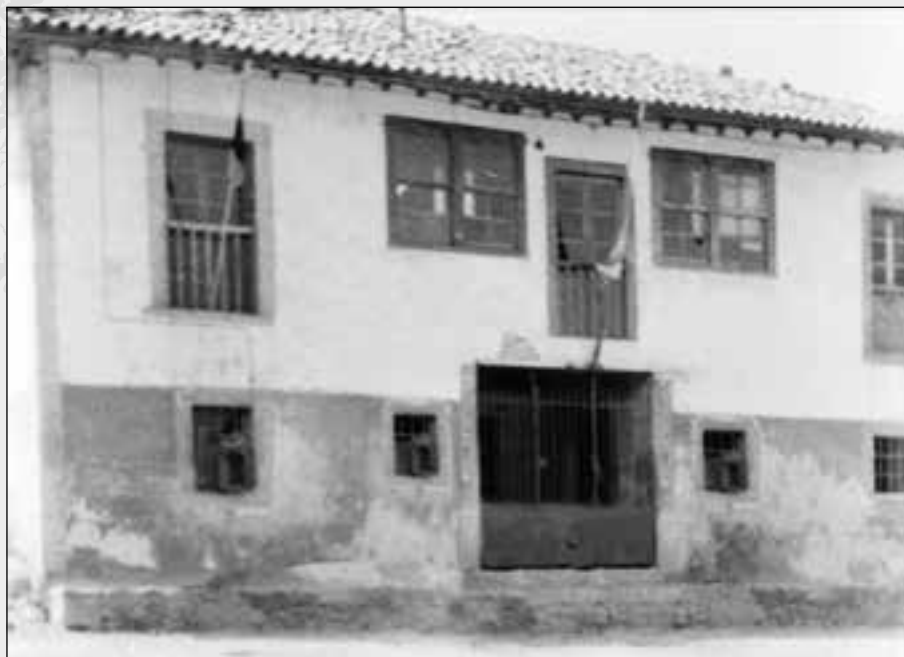
FACHADA DEL ANTIGUO AYUNTAMIENTO, AL QUE SE CONOCÍA TAMBIÉN POR EL NOMBRE DE LA PORTALADA, POR TENER 2 PORTALES. FOTO JOSÉ M a GONZÁLEZ VILLANUEVA, 1958

Evidentemente, sabemos que el juego político puede dar lugar a exageraciones, si bien, en la defensa del alcalde no se menciona nada al respecto, por lo que probablemente fuera cierta esa falta de documentación. De forma que, aunque desconocemos las causas y fechas de la desaparición, parece claro que una cantidad nada desdeñable de documentos se perdieron en algún momento anterior a 1933.