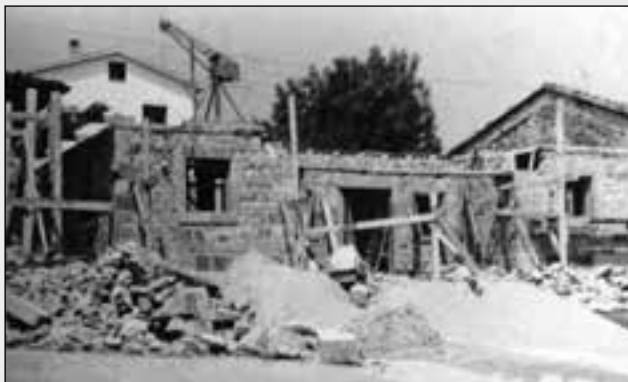
EL AYUNTAMIENTO EN OBRAS, MAYO DE 1970.

No ha sido posible hallar, hasta la fecha, antecedentes en el archivo municipal, relacionados con el anterior inmueble sobre forma de adquisición, documentación del mismo o su antigüedad 11 .