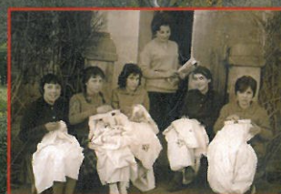
Talleres de costura en S. Cucao de Llanera