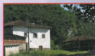
El origen de la casa de Andayón en el...