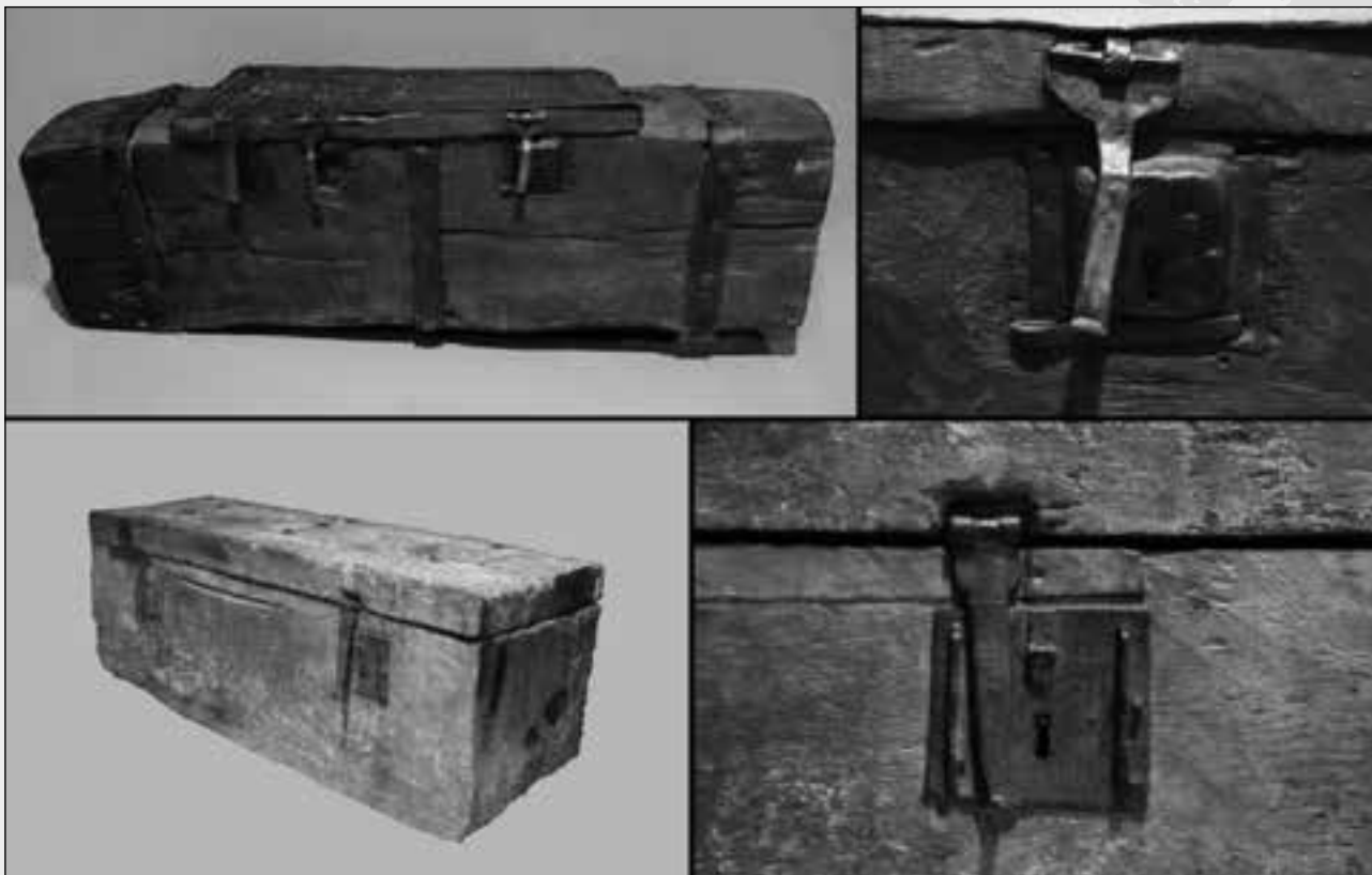
ARRIBA, EL ARCA DEL ANTIGUO CONCEJO DE LEITARIEGOS; ABAJO, EL ARCA DE LA COLEGIATA DE SALAS

a la tal arca que la pongan dos cerraduras e en cada cerradura la sua llave 5 .