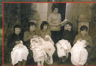
Talleres de costura en S. Cucao de Llanera