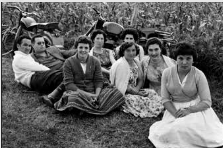
POR LA TARDE HABÍA ROMERÍA, PRIMERO EN EL CAMPO BÁRZANA, MÁS TARDE EN PRADOS PRÓXIMOS Y ALGÚN AÑO EN PREMIÓ. RIFABAN CORDEROS PARA AYUDAR A LA FIESTA.