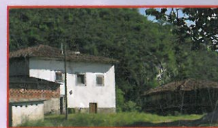
El origen de la casa de Andayón en el...