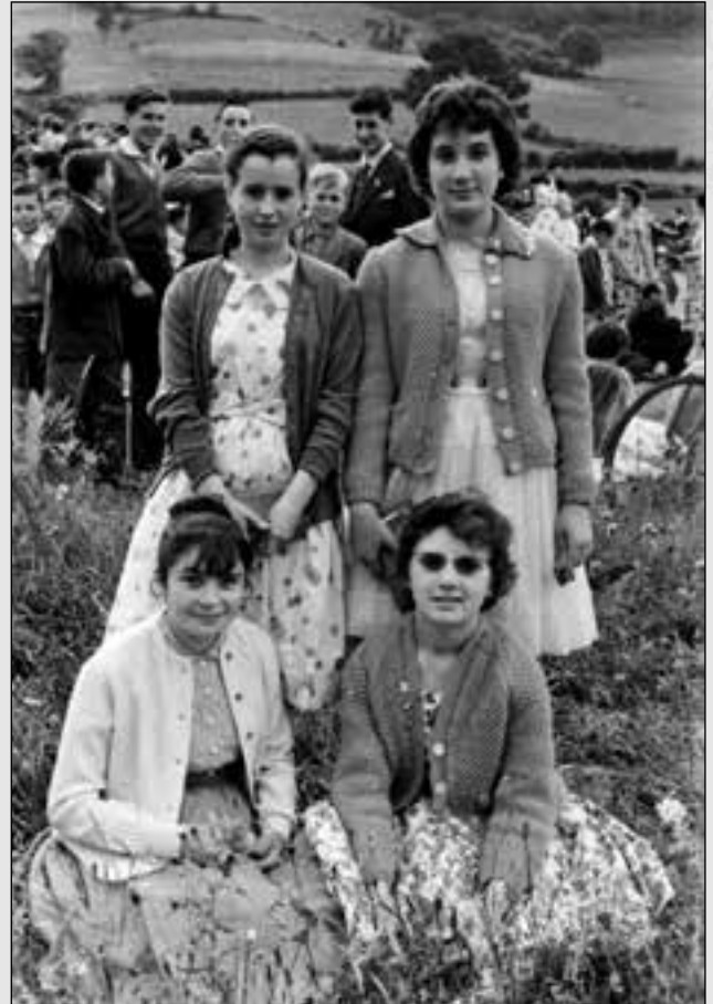
GRUPOS EN LA ROMERÍA