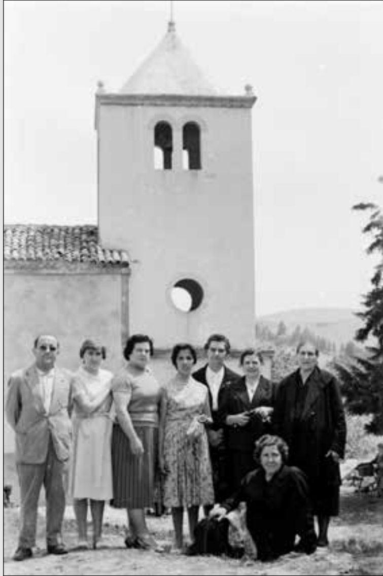
GRUPO FAMILIAR Y, A LA DERECHA, LA DULCERA JUNTO AL VIEJO TEXU, DESAPARECIDO