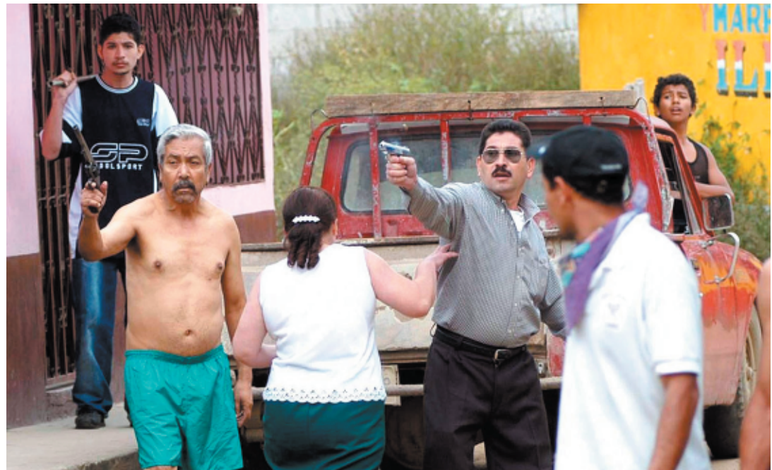
Vecinos de un barrio disparan a un grupo de manifestantes. San Pedro Ayampuc, 2003