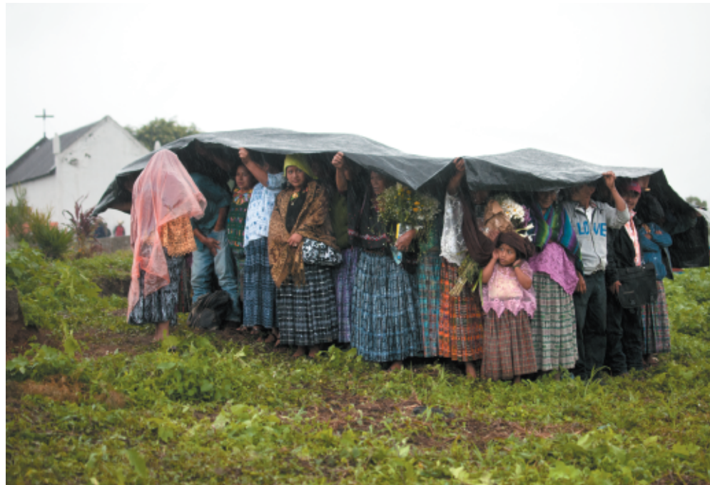
Mujeres se cubren de la lluvia durante la inhumación de víctimas de la guerra en Guatemala. Alta Verapaz, noviembre de 2013