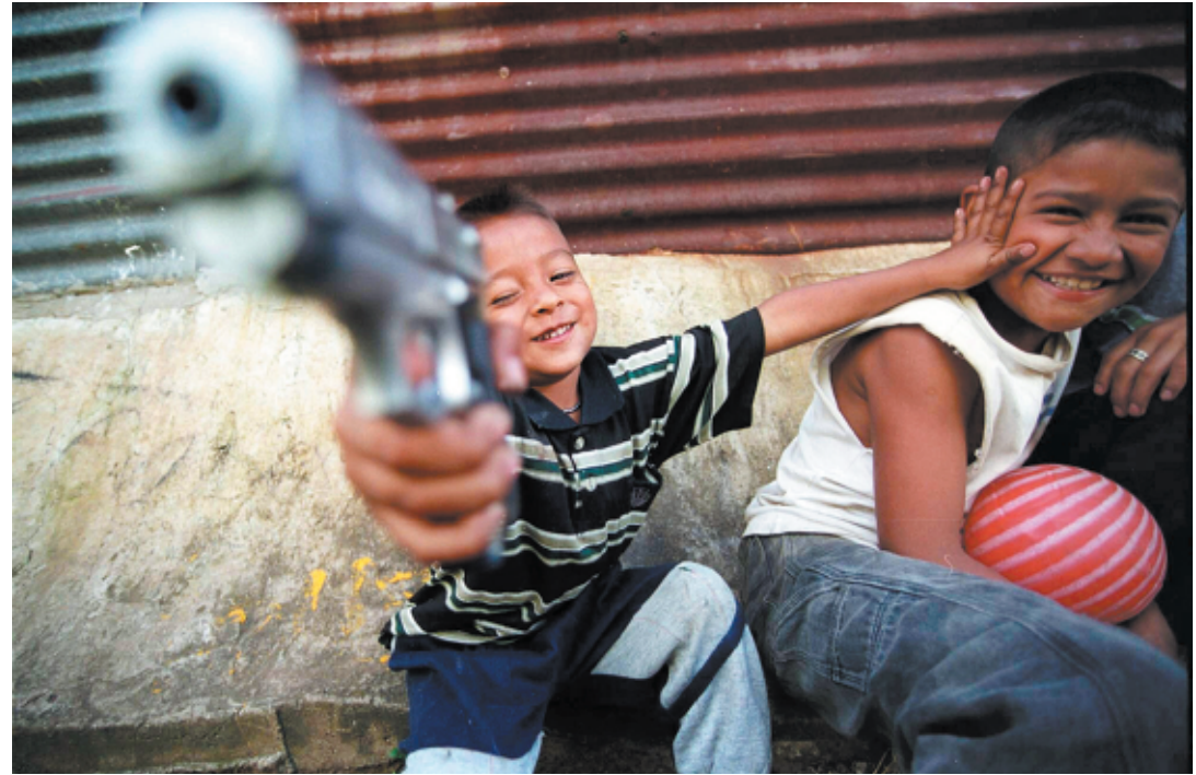
Niños con pistola de juguete. Ciudad de Guatemala, 2005.