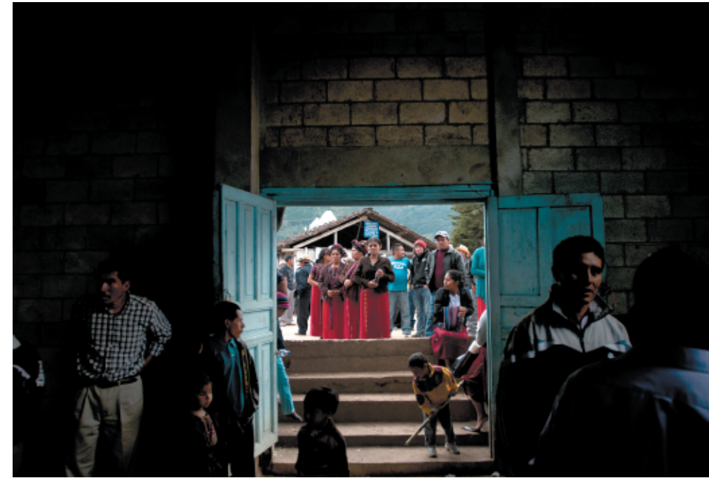
Centro de votación en Nebaj. Departamento de El Quiché, enero de 2014