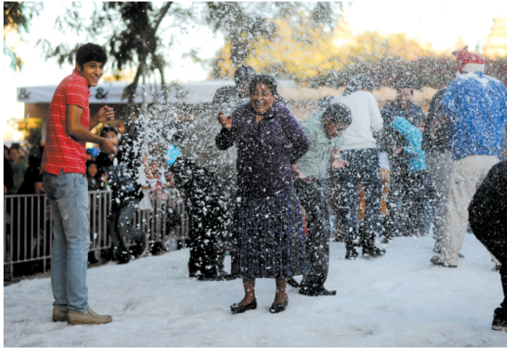
Nieve artificial en Ciudad de Guatemala. Diciembre de 2013