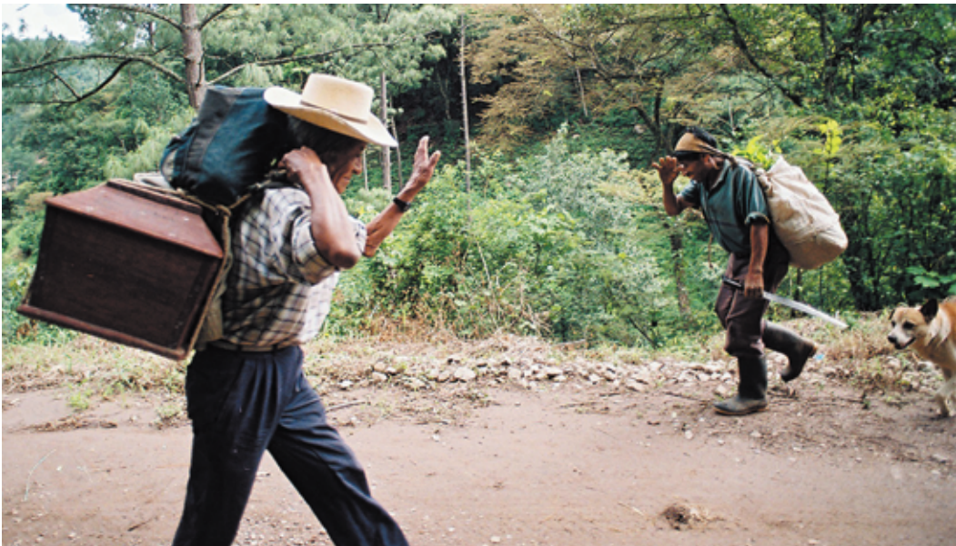
Hombre carga el ataúd de una víctima del conflicto armado interno. Chimaltenango, julio de 2005