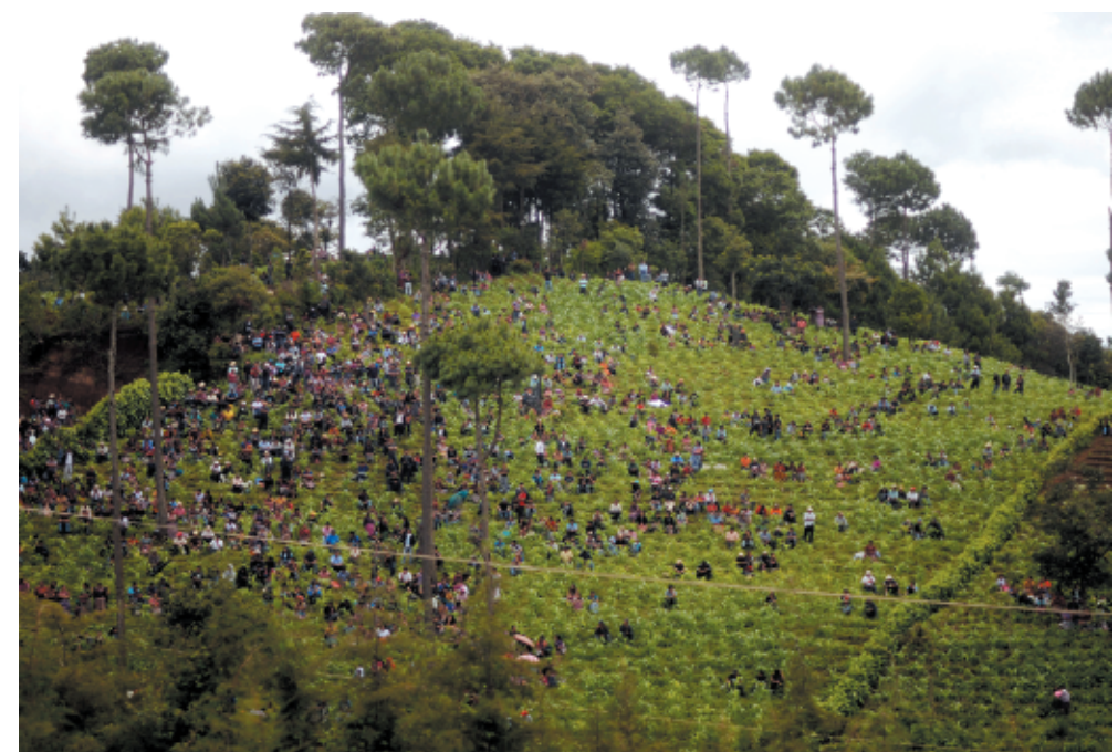
Manifestación en contra de la instalación de una cementera. San Juan Sacatepequez, julio de 2013