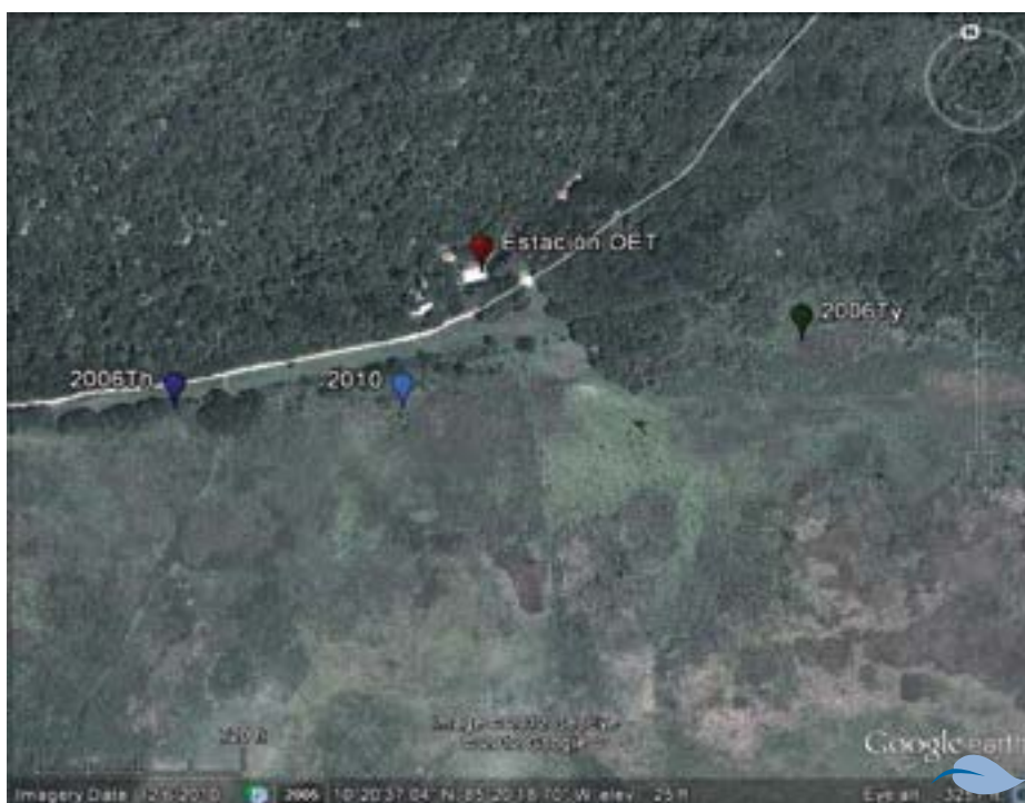
Figura 1. Puntos utilizados para los censos de aves en el humedal Palo Verde.

Varios esfuerzos se han desplegado para controlar las densas masas de tifa y mantener el hábitat de aves, siendo más eficiente la técnica de preparación de sitios y control de malezas usado por los arroceros locales y conocida como fanguero (McCoy y Rodríguez, 1994). El fanguero implica el paso repetido de un tractor agrícola con ruedas metálicas pesadas con el objetivo de triturar los tallos de la vegetación emergente del humedal y dejarlos bajo el agua, creando así espacios abiertos en el humedal. Estudios previos en el humedal objeto de estudio han comparado las comunidades de aves en sitios dominados por tifa, y recientemente tratados con fanguero, con sitios que no habían sido tratados con fanguero y densamente dominados por tifa (Trama, 2005; Osland, 2009); sin embargo, ningún estudio ha investigado las comunidades de aves en los sitios tratados con fanguero en el pasado donde la vegetación ha crecido nuevamente, una condición que describe ahora la mayoría de los pantanos de Palo Verde.