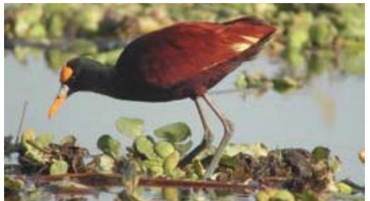
Arriba: Espátula rosada Abajo: Jacana espinosa Federico Rizo-Patrón

También se construyó una matriz con el índice de similitud de Bray-Curtis usando el programa Primer 6.0 (Clarke y Gorley, 2006). Esta matriz se utilizó para llevar a cabo un análisis de escala multidimensional no métrica (MDS por sus siglas en inglés), que es una técnica de ordenación usando datos de distancia para trazar puntos de conteo individual en ejes ortogonales