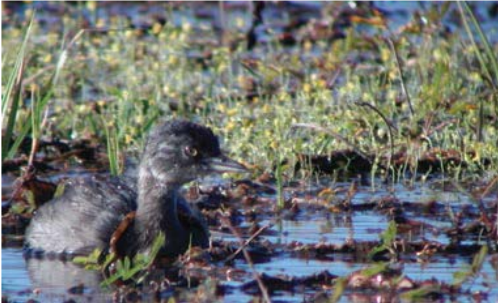
Zambullidor enano, Florescia Trama

indica que ambos sitios proporcionan un hábitat adecuado para estas aves. Esto sugiere que algunas zonas del humedal pueden favorecer grandes comunidades de aves sin un fanguero anual.