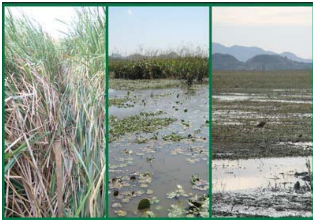
Figura 2. De izquierda a derecha, los sitios censados en el conteo de aves: 2006Ty, 2006Th y 2010.

un sitio con densas masas de tifa mezclada con algunas otras plantas acuáticas emergentes, como la platanilla ( Thalia geniculata ). El tercer sitio, denominado “2006Th”, fue también manejado con fangueo en marzo de 2006, pero presentó una mayor diversidad de hábitats que el sitio 2006T, con espejos de agua, vegetación acuática flotante y emergente, principalmente platanilla ( T. geniculata ) (figura 2).