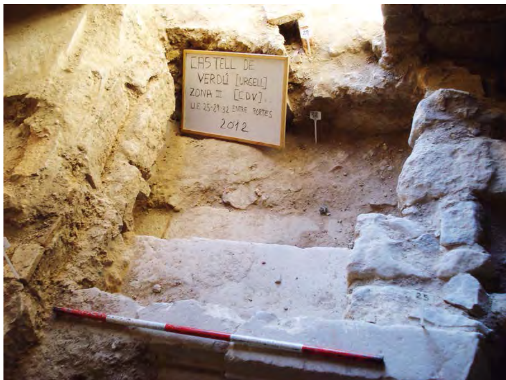
Foto 13. Restes dels enllosats de llosa, rajola i ciment.