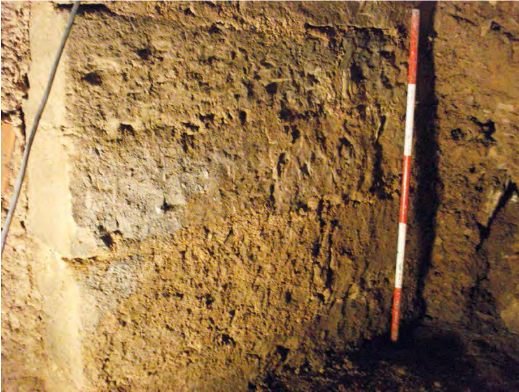
Foto 14. Cantonada de pedra de color negre, ben escairada, a l'interior del pou.

recobrir amb una capa possiblement de calç, de les quals encara quedaven algunes restes. El més sorprenent va ser que es va localitzar una cantonada de pedra ben escairada que correspondria a la part exterior de la bodega actual del castell, i que era feta de pedra de color negre, UE 35, de les mateixes característiques que les del mur de les espitlleres.