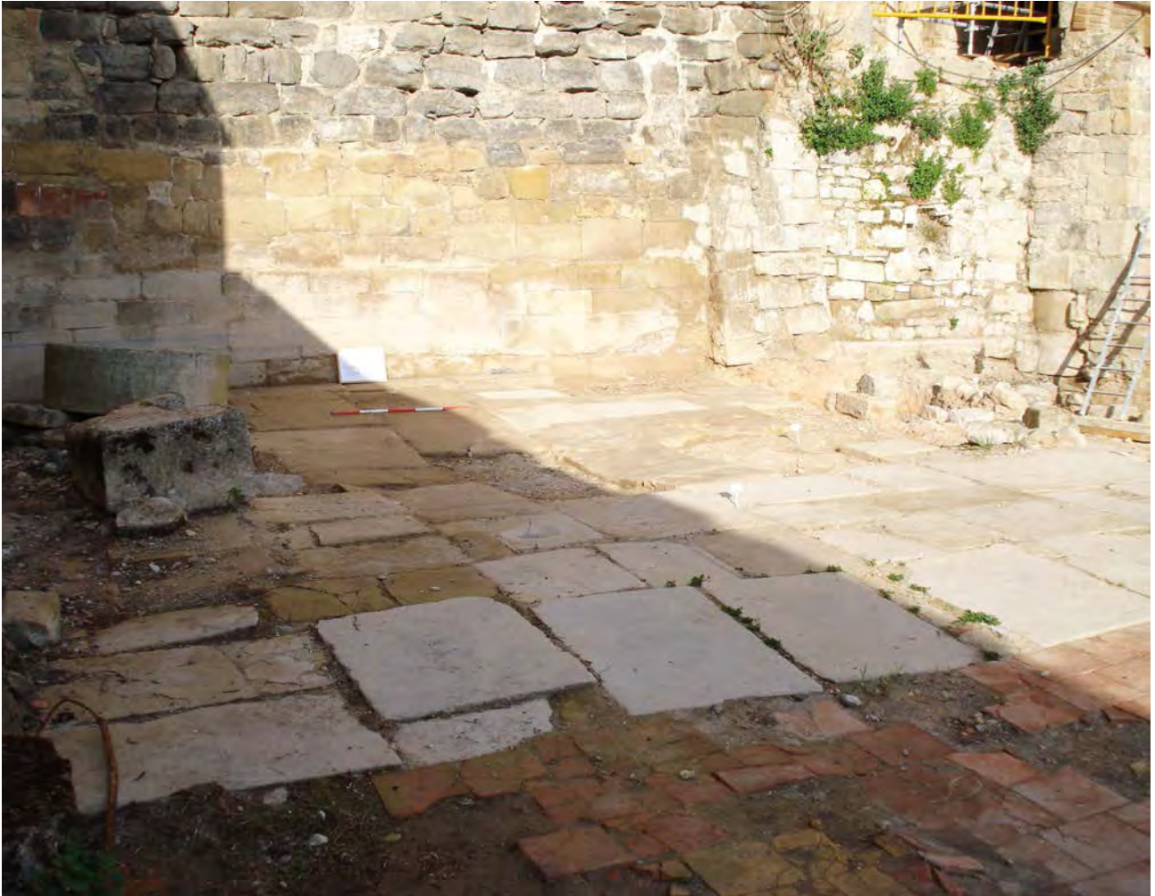
Foto 5. Lloc on hi havia prevista la construcció de l'habitable per a serveis del recinte. S'hi pot veure el detall dels carreus semblants als de la muralla dels segles xv-xvi.