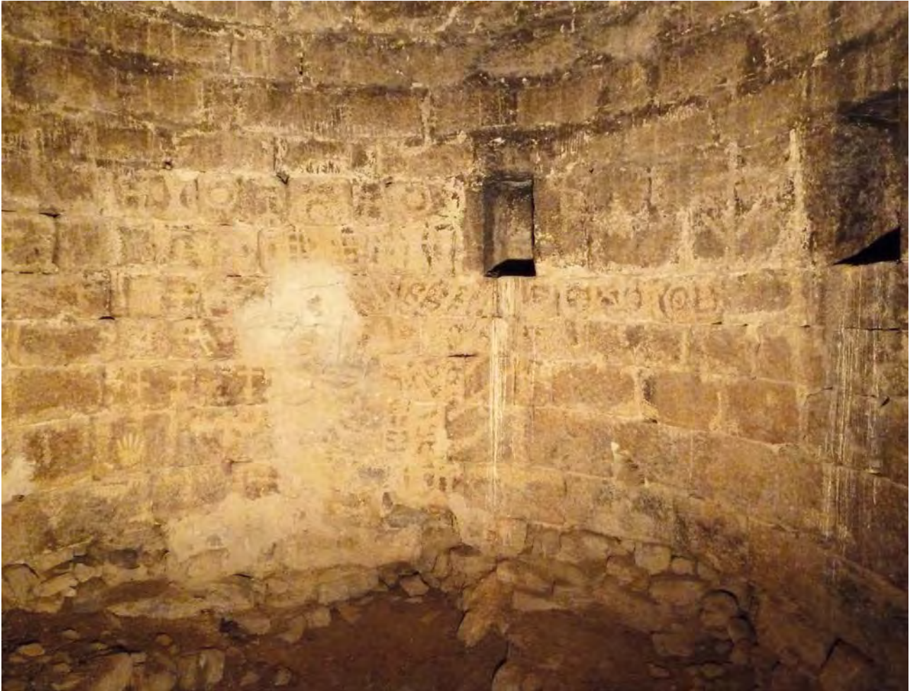
Foto 19. Imatge de l'interior de la presó de la torre, amb grafits que podrien correspondre a alfabet hebreu.