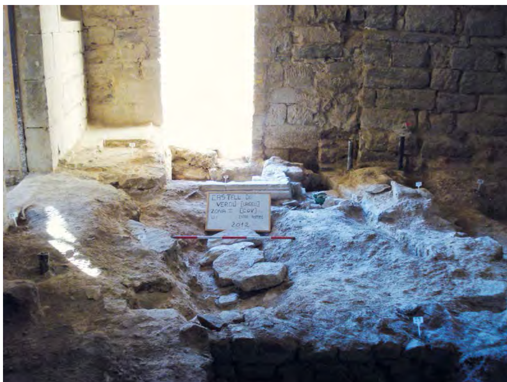
Foto 11. Mur UE 19 i canalització UE 20.