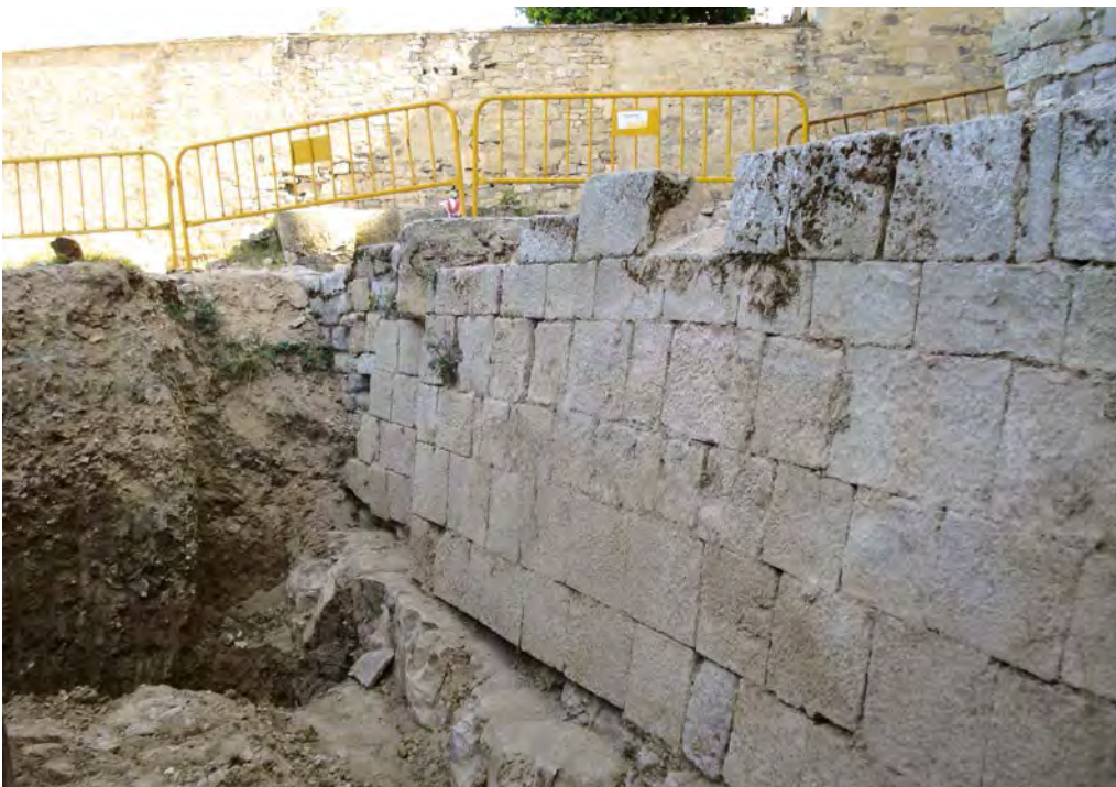
Foto 4. La muralla dels segles XV-XVI, amb la roca natural i l'argila.

fer-hi un accés cap a l'interior. En veure la totalitat del pany de muralla, es va veure la necessitat de fer la primera modificació del projecte, ja que no era el lloc adient per efectuar l'accés.