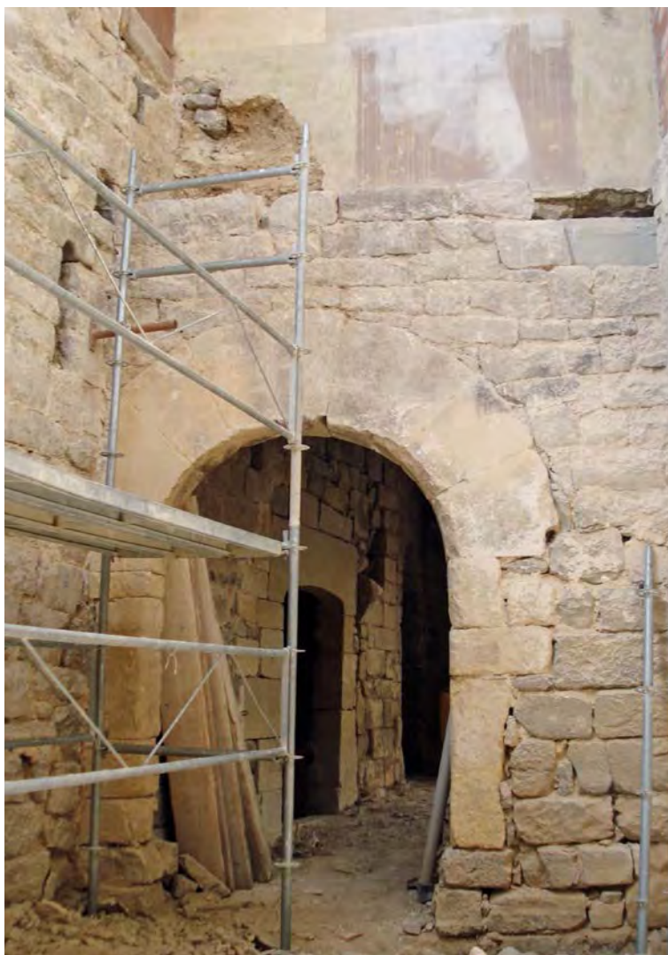
Foto 10. Restes del mur de tàpia damunt la porta romànica i com aquesta forada el mur de pedra de color negre.

Sembla que aquest mur també trencava un mur de pedra UE 22, que era per accedir a la porta romànica. La canalització de pedra també es trencava per la construcció