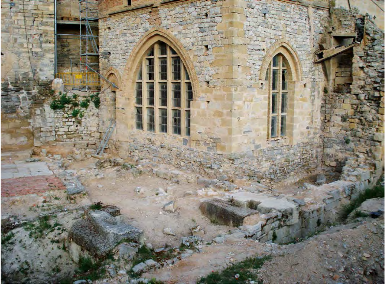
Foto 2. Estat del lloc abans de començar els treballs de control arqueològic.