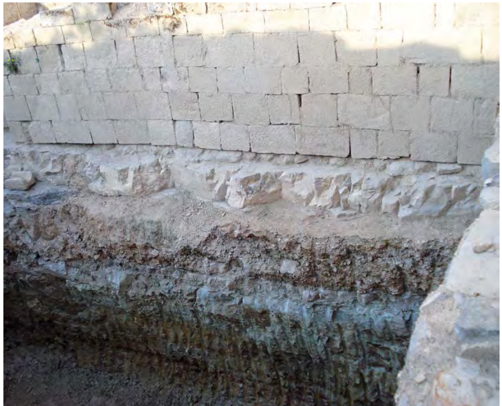
Foto 6. La muralla dels segles xv-xvi, amb el rebaix per construir els edificis de serveis previstos.