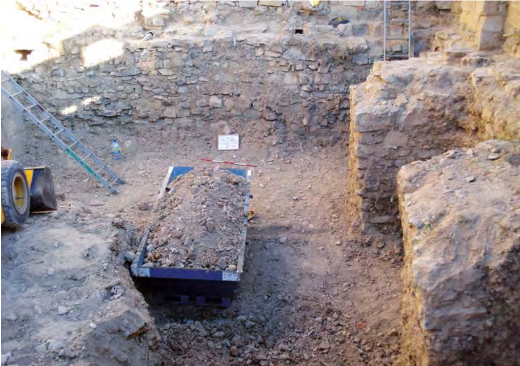
Foto 3. Contraforts apareguts en la muralla dels segles XVIII-XIX.