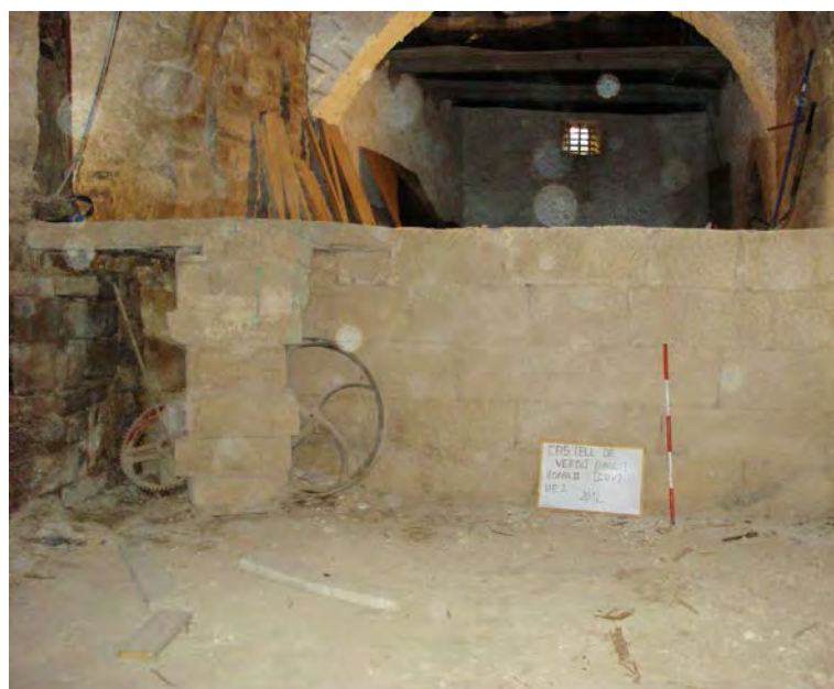
Foto 7. Aixecament de les sitges respecte al nivell de pas.

La sitja quadrada UE 3 té unes dimensions de 3,15 m per 4,35 m d'alçària. Està coberta de lloses de pedra de grans dimensions. Al mig es localitza una arcada que, a la vegada, fa de suport a l'enllosat UE 1. La sitja rodona té un diàmetre de 3,20 m i una alçària de 4,38 m. Els primers 80 cm del seu nivell de terra estan enrajolats de color vermell; la resta de les parets, fins a la superfície,