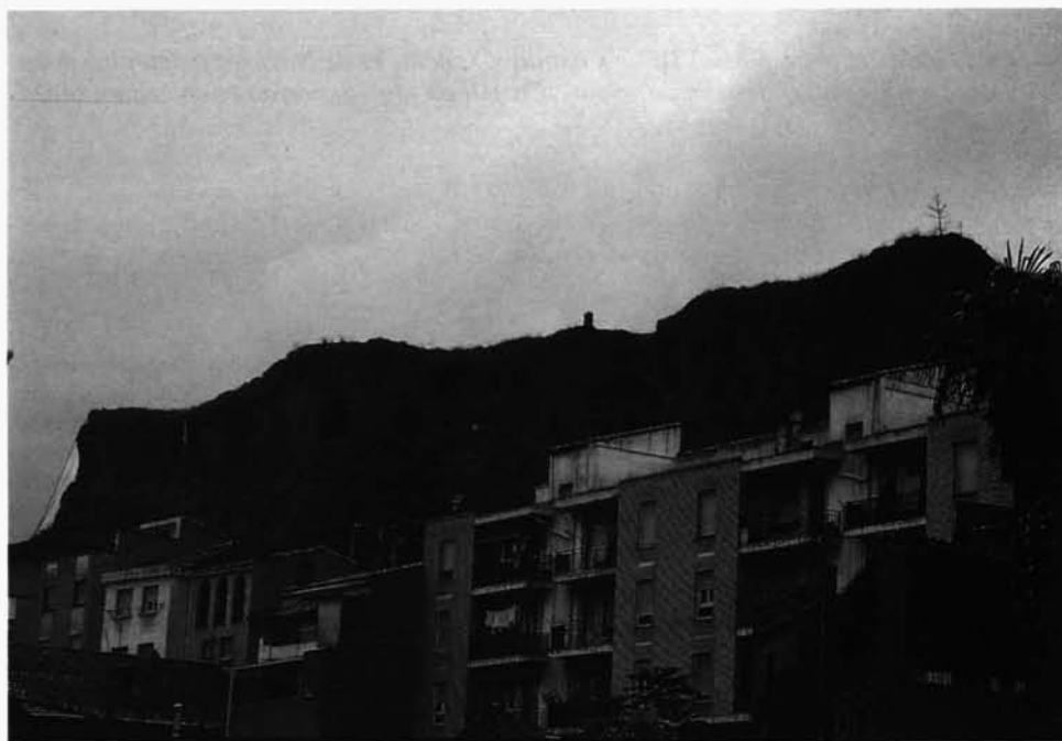
Lám. 1: Arnedo: Cerro de San Miguel o «Calvario».

Pudo erigirse aproximadamente hacia los siglos IX o X por los señores de Arnedo en el cerro de San Miguel, junto a las cruces finales del Calvario (Lám. 1). Su primera cita documental corresponde al siglo XI: