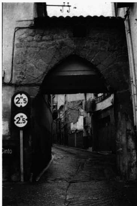
Lám. 2: Arnedo: Puerta del Cinto o de Nuestra Señora de las Nieves.

sobre si debía pujar la Parroquia o el Ayuntamiento. Lo hizo la primera y se le adjudicó por la base de licitación de 2000 pts.