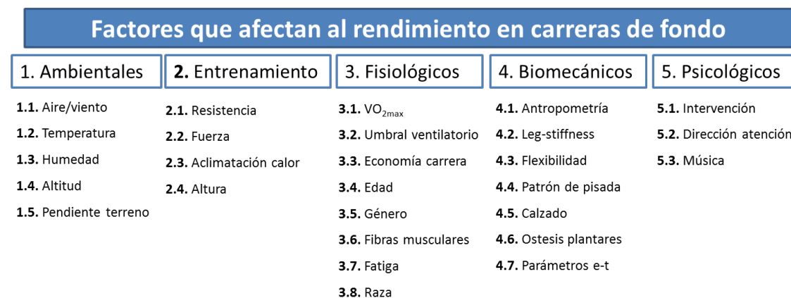
Figura 1. Factores que afectan al rendimiento de las carreras de fondo.

La mayoría de los estudios que han esquematizado la influencia de estos factores en el rendimiento lo han realizado a través de la economía de carrera (i.e., gasto energético a una velocidad de carrera submáxima determinada) (Saunders, Pyne, Telford y Hawley, 2004). Así, Svedenhag (2000) identificó 13 factores determinantes de la economía de carrera (distancia de la especialidad, entrenamiento y puesta a punto, pendiente del terreno, temperatura, aire y viento, fatiga, ventilación, amplitud de zancada, rigidez/componentes elásticos, otros factores biomecánicos, género, edad y estado emocional/psicológico). A su vez, Saunders y col. (2004) los agruparon y dividieron en 5 grandes grupos (entrenamiento, ambientales, fisiológicos, biomecánicos y antropométricos). Y aunque los factores que se comentan tienen repercusión en la economía de carrera, y ésta a su vez en el rendimiento, la economía de carrera no deja de ser uno más dentro de los factores fisiológicos que afecta al rendimiento (Basset y Howley, 2000). Por lo tanto, para esta revisión se ha optado por adaptar y ampliar las clasificaciones anteriores, identificando 5 grandes bloques de factores (ambientales, entrenamiento, fisiológicos, biomecánicos y psicológicos) que afectan al rendimiento durante las carreras de fondo (Figura 1).