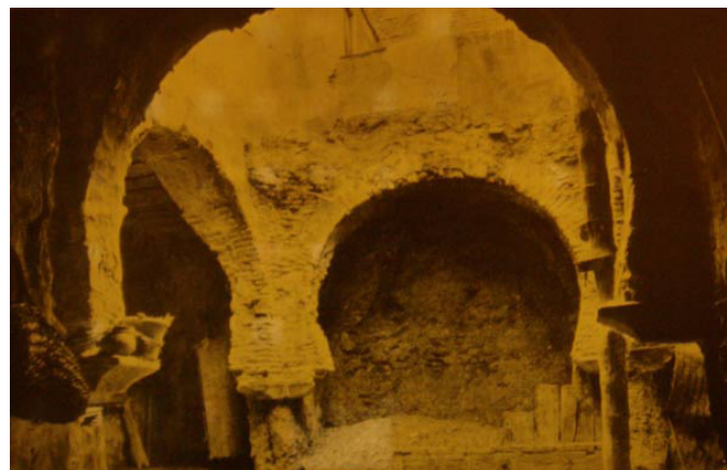
Foto: Interior de los Baños Árabes que estuvieron situados en la calle Madre de Dios.

Antes al contrario, se diría que la pauta que puede observarse si se analiza el relato subyacente a la actuación de las autoridades de la ciudad, no consiste en la preservación del patrimonio y el replanteamiento de la Marca Ciudad como un referente en tanto que polo de atracción de turismo histórico-cultural; sino que la actuación de los poderes al cargo, ha consistido, de manera sistemática, en atender contra dicho patrimonio, ignorando su interés tanto objetivo, como potencial por lo que podría suponer para situar a la ciudad como referente casi exclusivo para el estudio del pasado árabe de la Península Ibérica.