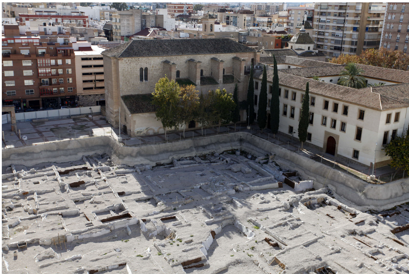
Foto: Yacimiento de San Esteban.

En los últimos meses de 2009, se descubrió en una zona muy céntrica de la ciudad de Murcia 1 (junto al Palacio de San Esteban, sede del Gobierno Regional), merced a las obras que se estaban realizando para la construcción de un aparcamiento subterráneo, un yacimiento arqueológico de una extensión, cuando menos, sorprendente. En total, fueron apareciendo, en una hectárea de terreno, los muros de cuarenta y ocho casas árabes, siete palacios (seguramente destinados a hospedar a altos dignatarios de la época), una gran avenida, un pequeño oratorio, una pequeña necrópolis e incluso una pequeña mezquita con la base de su minarete 2 . El yacimiento corresponde fundamentalmente al barrio islámico del siglo XIII, con elementos pertenecientes al siglo XII e incluso también al siglo XI, aunque este extremo esté aún por determinar, puesto que los trabajos de excavación y por tanto de datación de los restos se hayan inconclusos 3 .