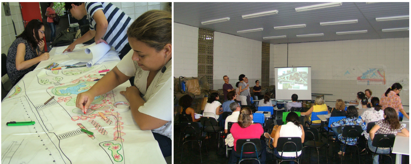
Figura 4. Atividades em ateliê: elaboração, apresentação e discussão das propostas