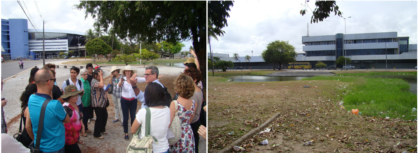
Figura 3. Visita técnica na Praça Ministro Salgado Filho. Equipe do workshop , lado esquerdo; e aspecto da falta de conservação da praça, lado direito.