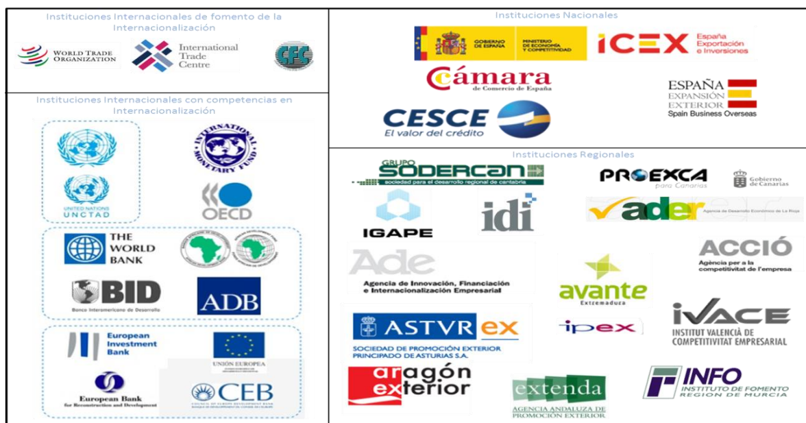
FIGURA 2: RESUMEN DE LAS ORGANIZACIONES DE PROMOCIÓN DE LA INTERNACIONALIZACIÓN