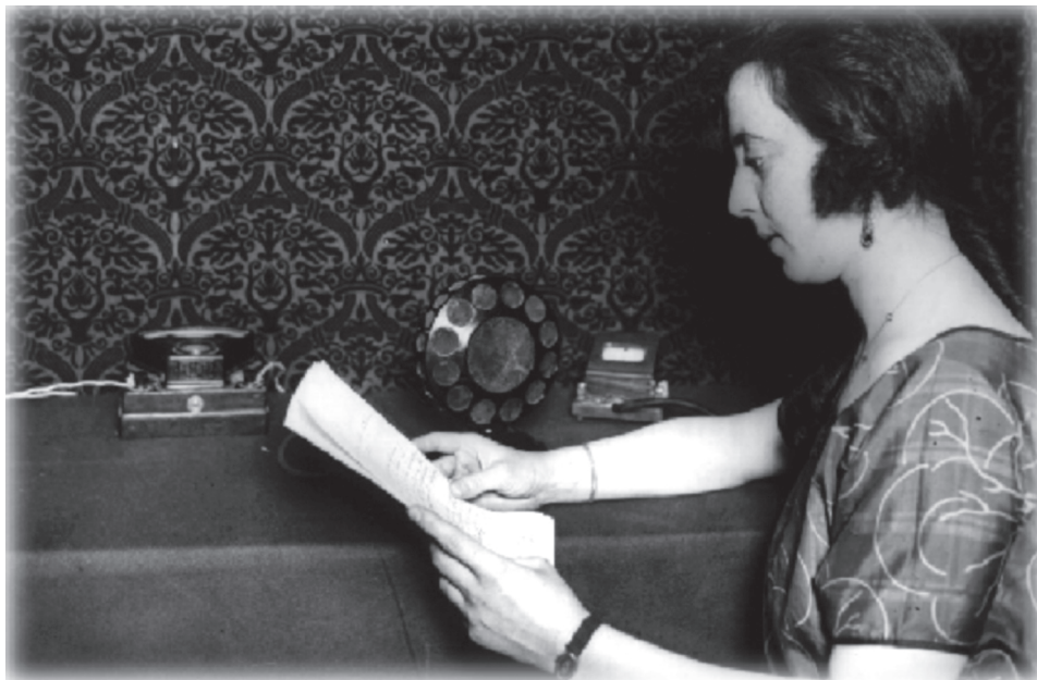
La Anunciadora de Radio Catalana. (Salillas, 1980).

en 1930. Esta será, como describiremos a continuación, la década en la que las mujeres desembarcaron de forma más numerosa ante los micrófonos españoles.