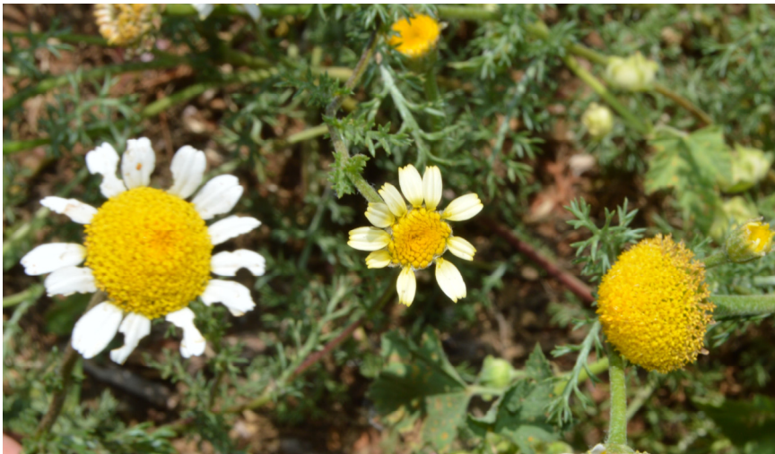
Fig. 3. Fotografía tomada en el lugar de recolección en la que se pueden observar, de izquierda a derecha, los capítulos de A. clavatus , A. × malvesiensis y A. valentinus respectivamente.