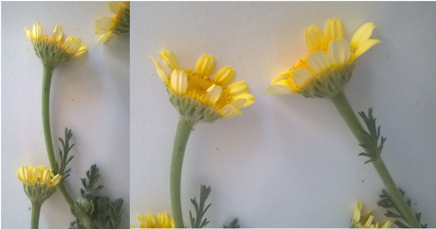
Fig. 2. Imagen y detalle de los capítulos de Anacyclus × malvesiensis .