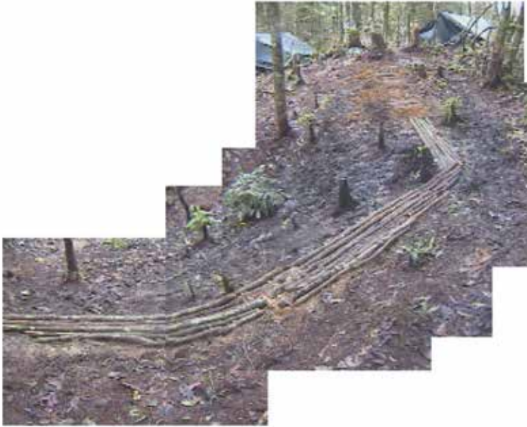
Figura 3. Caminos de comunicación en el campamento

Fuente: Los autores. Recortes de los recorridos de la filmación Fusiles de madera (2002)