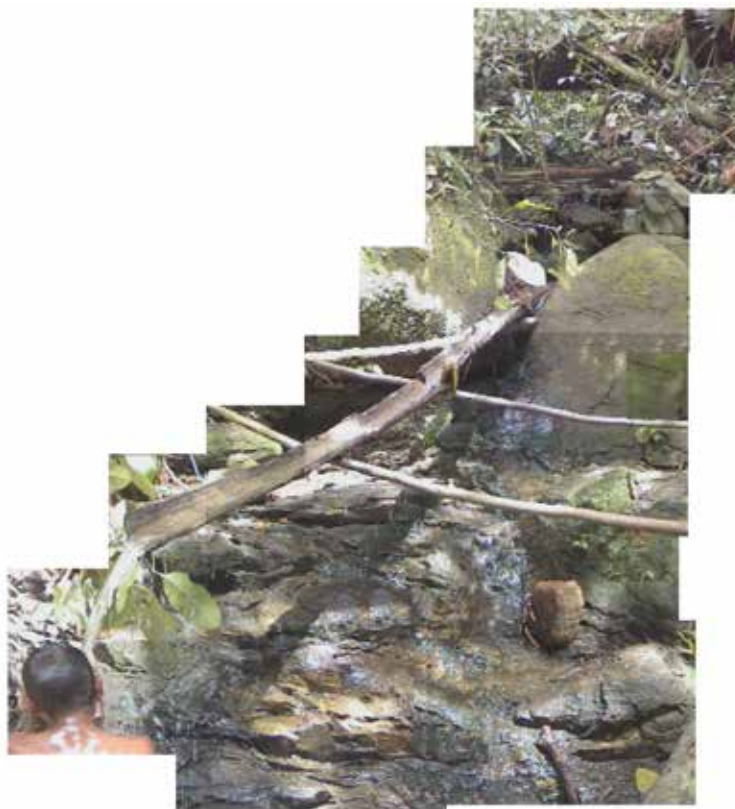
Figura 1. En el campamento 12