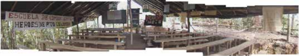
Figura 2. El salón del campamento

Fuente: Los autores. Recortes de los recorridos de la filmación Fusiles de madera (2002)