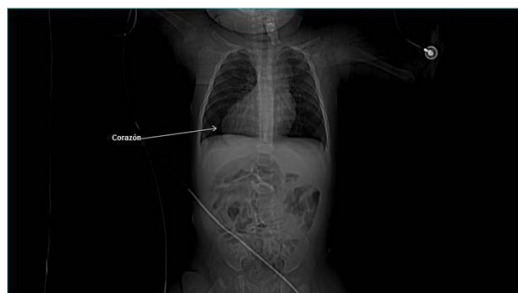
Figura 2 Tomografía simple toraco abdominal. Dextrocardia.