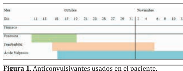
Figura 1. Anticonvulsivantes usados en el paciente.

medicamento anticonvulsivante, el ácido valproico (ACV); se inició también antibioticoterapia de amplio espectro con ceftriaxone y amikacina. (figura 2 y 3).