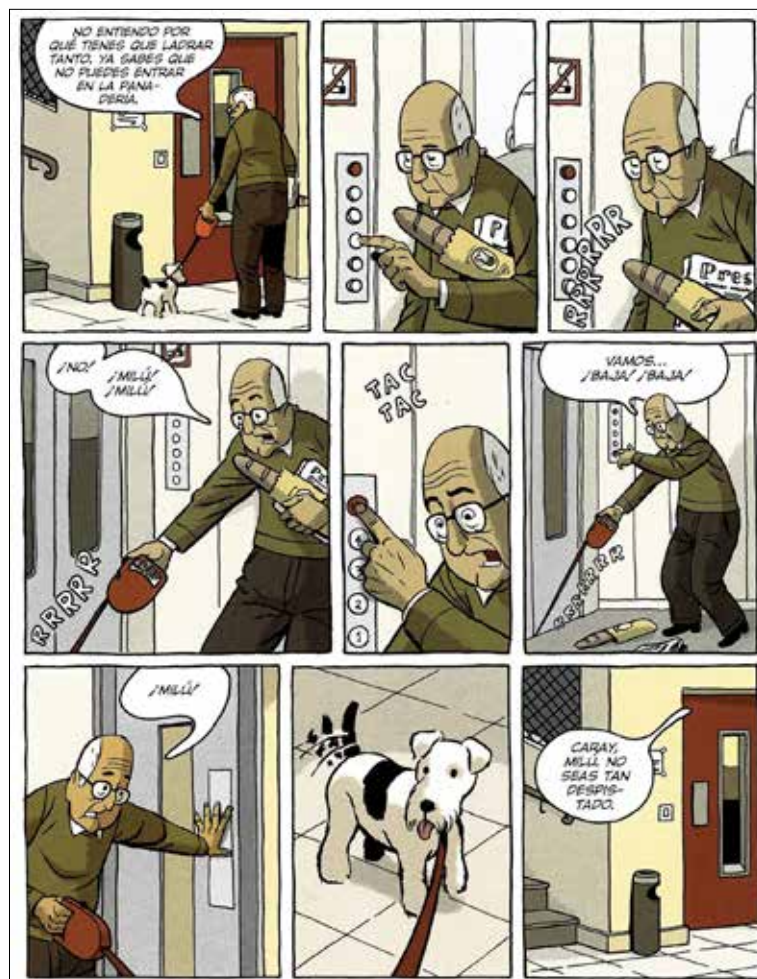
Figura 4. Paco Roca, Arrugas , 2008 (p. 100). Rides di Paco Roca © Editions Delcourt, France, 2007. L'edizione in spagnolo è stata pubblicata da Astiberri Ediciones

tivo, sono sconfortanti in quanto testimoniano il fallimento del linguaggio e di ogni narrazione di fronte all'alzheimer. Da una parte consola ammettere che il linguaggio non possa dare voce ad ogni cosa o debba capitolare dinanzi alla via crucis dell'ammalato di alzheimer, dall'altra parte questo suo tacere e piegarsi alla sofferenza muta dà un senso di sollievo perché rende tutto più umano. Così umano, troppo umano, che il lettore dopo le due pagine bianche, incontra, ad annunciare infinite altre vicende, alcune strisce con uno sbadato e distratto anziano accompagnato da un cane, a testimoniare che la solitudine, la mancanza di affetti, la malattia, riguardano molti altri anziani, oltre a Emilio, Miguel, Modesto, Sol, Rosario, Carmencita, Juan: