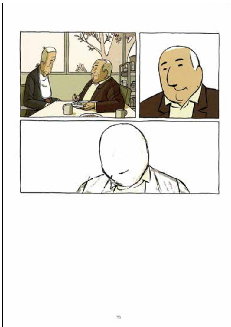
Figura 3. Paco Roca, Arrugas , 2008 (p. 96). Rides di Paco Roca © Editions Delcourt, France, 2007. L'edizione in spagnolo è stata pubblicata da Astiberri Ediciones

Alla fine si vedono soltanto i contorni delle figure e degli oggetti e tutto si dissolve e si disperde, striscia dopo striscia, fino a lasciare nelle mani del lettore due pagine completamente bianche, significativamente bianche (Roca 2008, pp. 98-99).