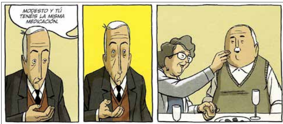
Figura 1. Paco Roca, Arrugas , 2008 (p. 55). Rides di Paco Roca © Editions Delcourt, France, 2007. L'edizione in spagnolo è stata pubblicata da Astiberri Ediciones

La forza del disegno di Paco Roca sta nell'introdurre il lettore nell'universo privato nel quale vivono gli anziani, raccontando pensieri e sensazioni dell'ammalato di alzheimer che il mondo esterno non percepisce. In tal senso è straordinaria nella sua drammaticità la vignetta che illustra quando Emilio si rende conto di soffrire di alzheimer e che il futuro che lo attende è quello di Modesto. Infatti il momento più duro è quando ci si rende conto di avere l'alzheimer. Paco Roca lo fa con un vignetta, l'unica di tutta la novela gráfica nella quale predominano i toni pastello: