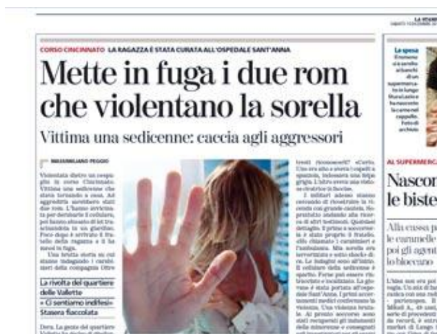
Fig. 1. El artículo.

cuales la convocación de una manifestación contra la violencia. Tras la apariencia oficial de una manifestación pacífica, circuló sin embargo por el barrio un panfleto con un claro mensaje.