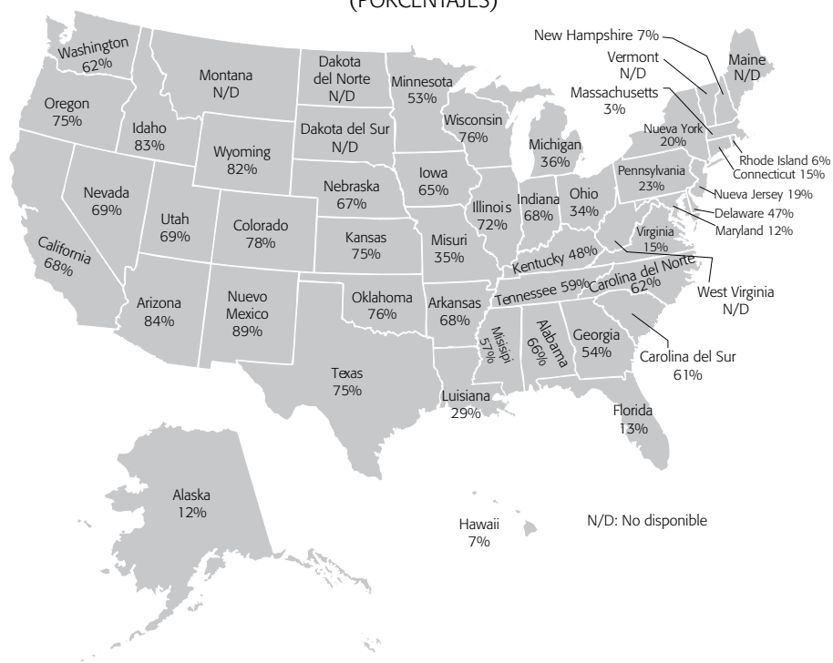
Mapa 1 INMIGRANTES MEXICANOS INDOCUMENTADOS POR ESTADO (2012) (PORCENTAJES)

Nota: Porcentajes calculados con números sin redondear. Fuente: Pew Research Center (2015).