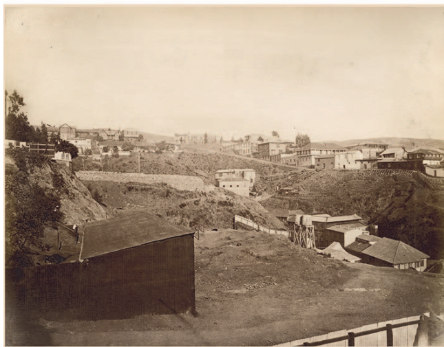
Imagen 2 Díaz y Spencer, c. 1885. Museo Histórico Nacional (Santiago, Chile), Colección Fotografía Patrimonial, N° de Inventario AF-72-92

En el primer y segundo tramo de los cerros, que fue habitado en el siglo XIX, es posible generalizar alguna distinción: las viviendas de las personas de mejor pasar en las lomas, o en las pendientes menos abruptas (como puede verse en la imagen 2, y como las que hemos descrito en el párrafo anterior), y las más pobres en las laderas, mirando al mar de costado y aferrándose a la vertical (ver la imagen 3). Pero unas y otras son vecinas en un mismo cerro.