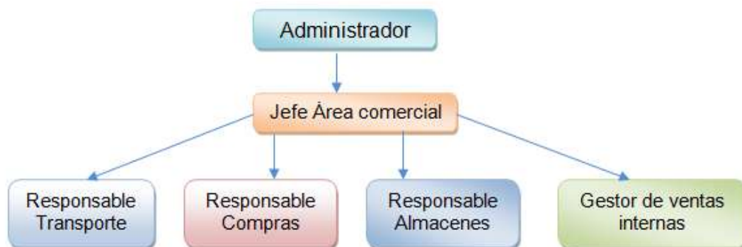
Fig. 2. Estructura del Área Comercial.

La organización de la actividad de marketing responde a la necesidad de coordinar los esfuerzos que en este sentido se realizan. Para ello, se propone que se implemente la siguiente estructura para el área funcional: