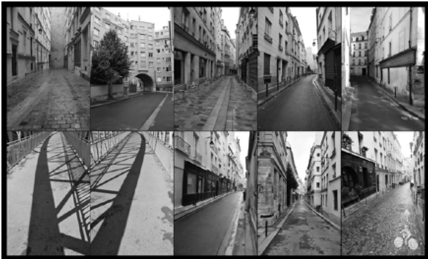
Figura 2 - Ruas-Galerias (Paris).