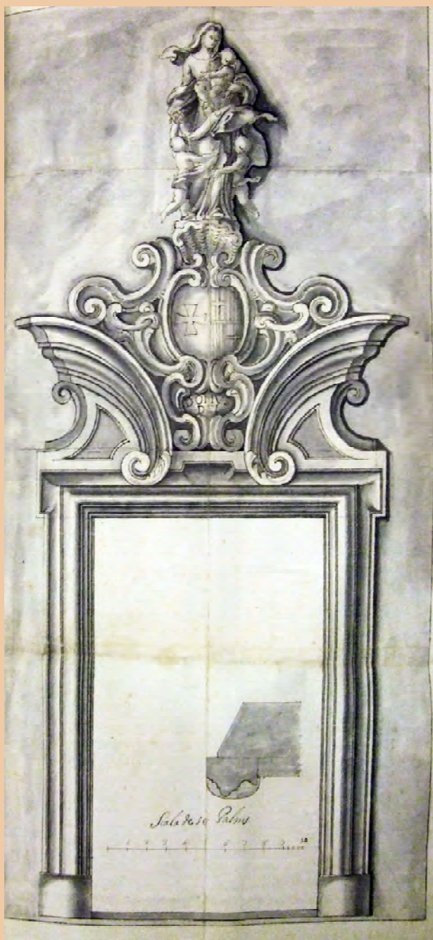
Traça de la portalada de l'església de l'Hospital de la Santa Creu de Barcelona, original de Pere Costa.

També destacà en el camp de l'arquitectura, amb projectes com el de la portalada de l'església de l'Hospital de la Santa Creu de Barcelona, traçat l'any 1728 i construït pel mateix Pere Costa poc