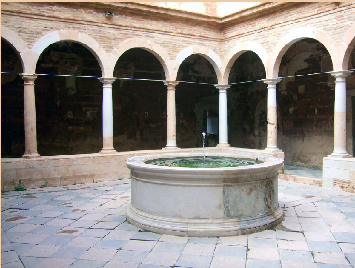
Aspecte actual del claustre menor o de Recordationis de la cartoixa d'Escaladei, reconstruït recentment amb diversos fragments recuperats d'entre la ruïna.

Barraquer i Roviralta no pogué reunir suficient informació per descriure el trasbals ocasionat per la guerra del Francès (1808-1814) als monjos d'Escaladei. Tanmateix, diferents estudis posteriors han posat de manifest que les tropes napoleòniques assaltaren i saquejaren la cartoixa almenys dues vegades el mes de novembre de 1810, si bé no ha estat possible establir la magnitud del