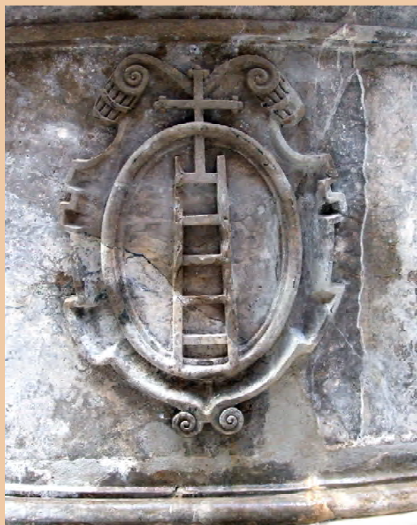
Escut d'Escaladei esculpit al brollador situat al centre del claustre menor o de Recordationis de la cartoixa.

L'urna sobre la qual s'alçava el sol presentava un relleu historiat a la cara frontal i un altre relleu, igualment historiat, a la cara posterior, ambdós probablement de caràcter simbòlic. En el peu o en el basament s'hi podien veure dues targes: la frontal decorada amb les armes d'Escaladei i la posterior, amb un motiu que ignorem, potser també heràldic. Cal suposar que en tots aquests elements no hi faltaven els angelets i els motius arquitectònics, geomètrics i vegetals, com era propi de les obres barroques. D'altra banda, consta que tot el conjunt era daurat, inclòs l'interior de l'urna.