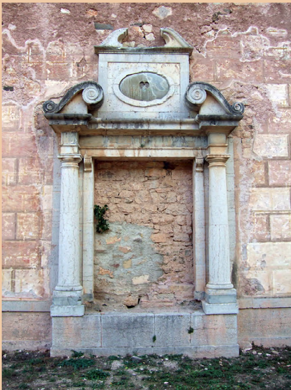
Portalada exterior de la capella del sagrari, construïda darrere del presbiteri de l'església de la cartoixa d'Escaladei. (Fotografia de l'autor.)

Des de l'any 1713 fins a la dècada de 1730 dom Agustí Massot i dom Francesc Vidal exerciren alternativament el priorat a les dues cartoixes situades en territori català: Montalegre i Escaladei. Agustí Massot, nascut el 1675 i profés de Montalegre, fou prior d'aquesta cartoixa de 1713 a 1721, d'Escaladei de 1721 a 1726 i altra vegada de Montalegre de 1726 a 1732. Francesc Vidal, més gran