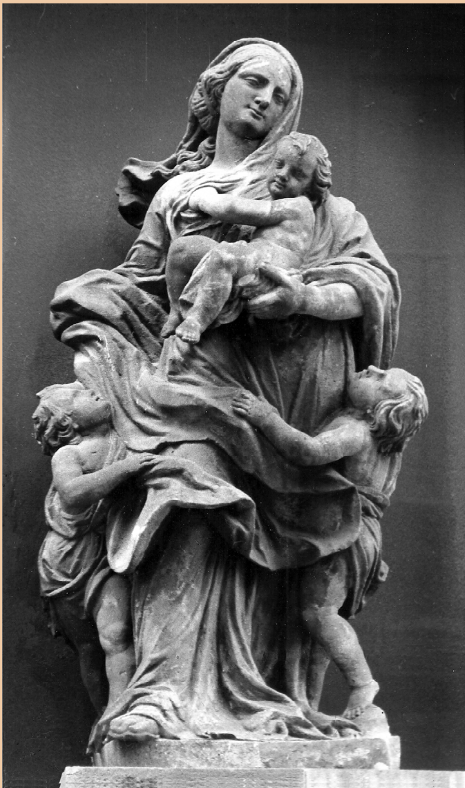
Portalada de l'església de l'Hospital de la Santa Creu de Barcelona: al·legoria de la Caritat, obra de Pere Costa.