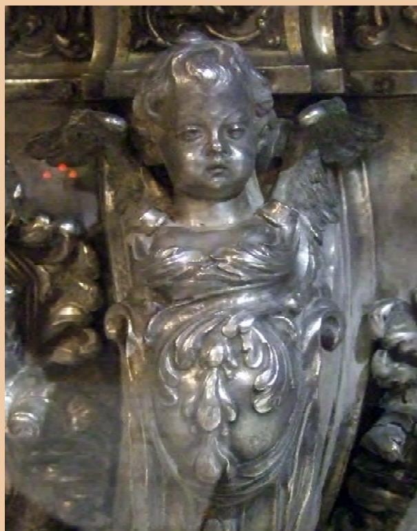
Detall de l'urna de sant Bernat Calbó: àngel construït per Joan Matons amb model de Pere Costa. (Catedral de Vic.)