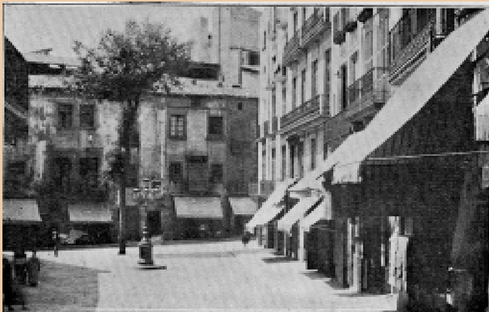
Plana de l'Om, l'any 1901, un dels espais més concorreguts de la ciutat de Manresa. Imatge editada a Album de Manresa. (Imprenta y Librería de Luís Roca).