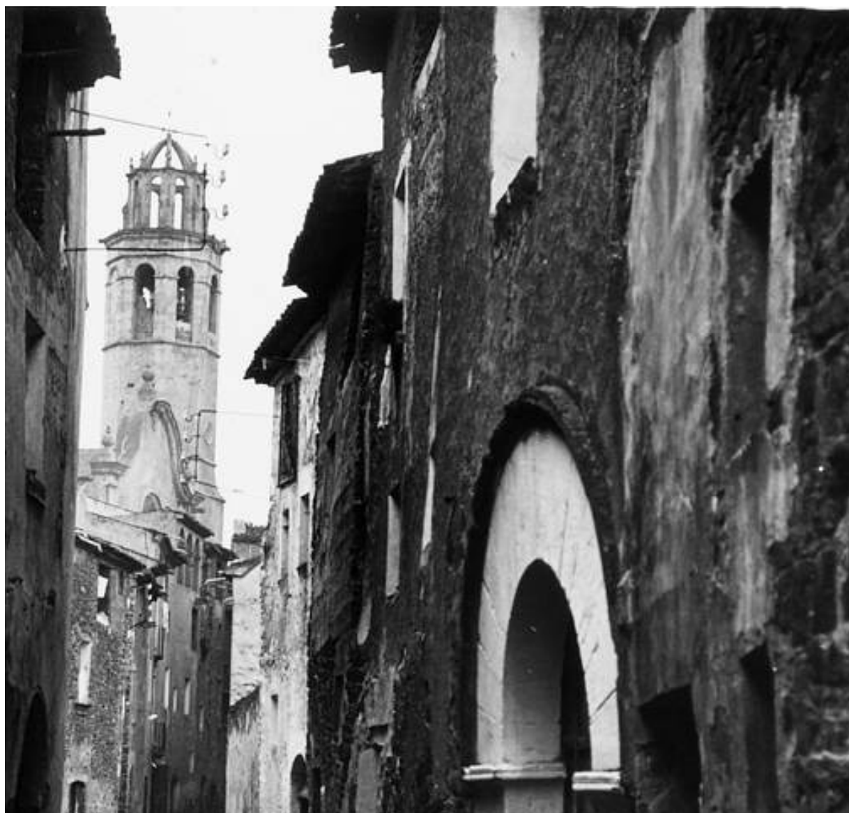
Carrer i església de Sarral. Foto Josep Salvany Blanch (1912). Biblioteca de Catalunya. Fons Salvany SaP_085_12

De les carlinades 24 es té notícia de l'incendi patit per la població l'any 1836. Amb tot, podria ser que la muralla encara hagués tingut una certa utilitat per evitar l'atac d'escamots només provistos d'armament lleuger. Per això deixem aquí el nostre estudi tot invitant a futurs investigadors a enriquir el coneixement del paper que aquesta construcció centenària jugà en la Història de Sarral.