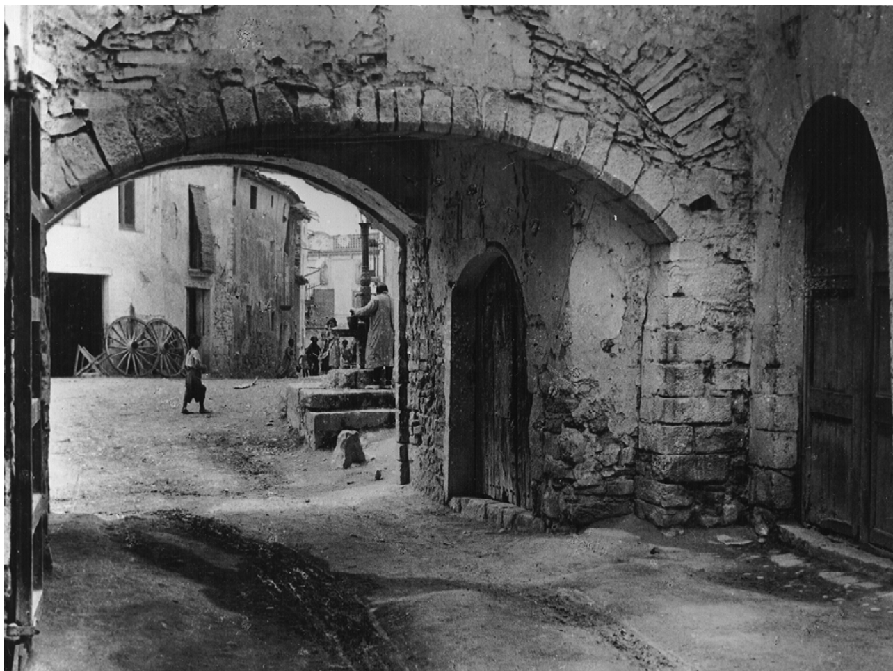
Antic portal de Sant Joan, que va existir fins a l'any 1934 i era la via natural d'entrada a la població venint del camí de Valls.

Durant l'any 1642 la Conca fou terra de ningú entre els exèrcits castellans, estacionats a Tarragona, i el franco-català, establert a Lleida, de tal manera que quan l'exèrcit castellà decidí atacar Lleida passaren en diferents ocasions provocant morts i destrucció indiscriminades. A tal fi els principals generals del rei castellà, Torrecuso, Hinojosa i Mortara passaren el 30 d'agost pels colls de Lilla i Cabra, cremant i assaltant Montblanc el dia 31, seguint vers L'Espluga i Poblet on feren una destrucció similar. El 3 de setembre entraren a Sarral, on cometeren tota mena de vexacions: cremaren la vila, saquejaren l'església i hi cometeren actes sacrílegs 19 . A la darrerria de setembre tornaren a passar per Sarral, incendiant vuitanta cases, acamissant-se amb els objectes sagrats de l'església i fent altres excessos. Tot sembla indicar que el 17 de novembre del 1647 la vila tornaria a ser assaltada i incendiada 20 . És prou evident que la muralla medieval poc podia fer davant l'artilleria i de les noves tàctiques militars emprades pels exèrcits contendents 21 . Cal afegir, com a mostra del cinisme de la monarquia castellana, que Felip IV atorgaria l'any 1653 al marquès de Mortara el marquesat de Sarral, un títol que comprenia les viles de Sarral i Cabra, viles que havia assaltat a sang i foc deu anys abans 22 .