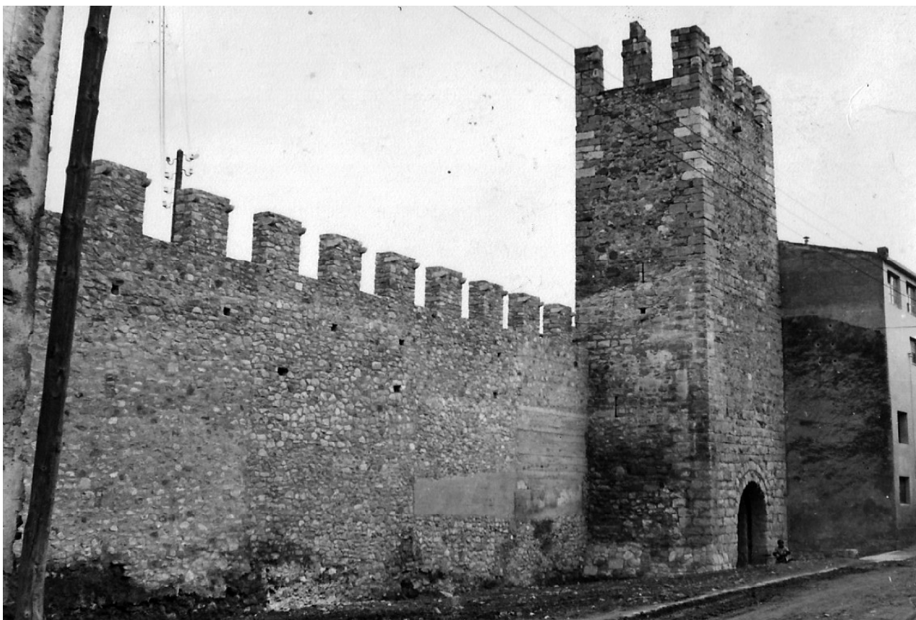
El mateix tram de muralla alliberat d'edificacions i restaurat. Octubre de 1969.