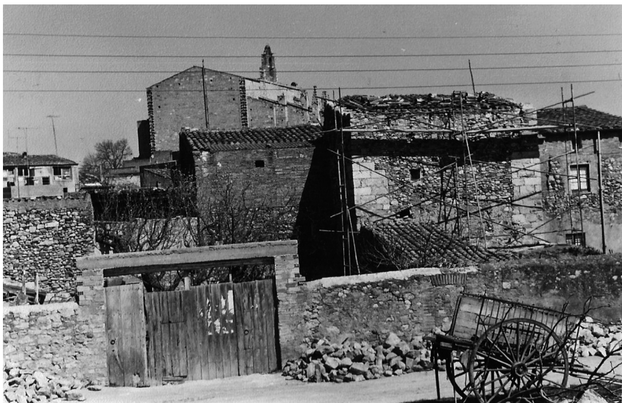
Corral adossat a la Muralla de Sant Jordi, març de 1969.