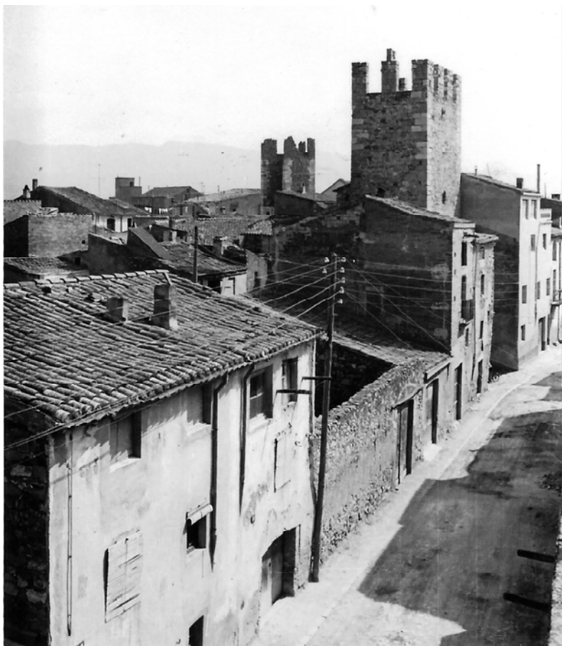
Cases i corrals adossats a la Muralla i Portal de Sant Jordi.