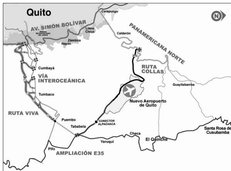
Gráfico 1. Vías definitivas de conexión de Quito con el NAIQ

2