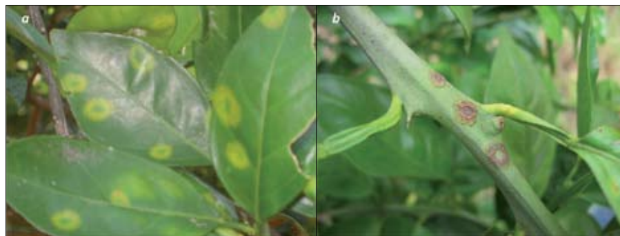
Figura 1. Lesiones típicas producidas por el virus de la leprosis de los cítricos en hojas (a) y ramas (b) de naranja 'Valencia' procedentes de los departamentos de Meta y Casanare, en los Llanos Orientales de Colombia.

Los primers utilizados en los análisis RT-PCR llevados a cabo en este estudio amplificaron específicamente un fragmento de 344 pb correspondiente a una región del gene que codifica para la proteína de movimiento del virus CiLV-C