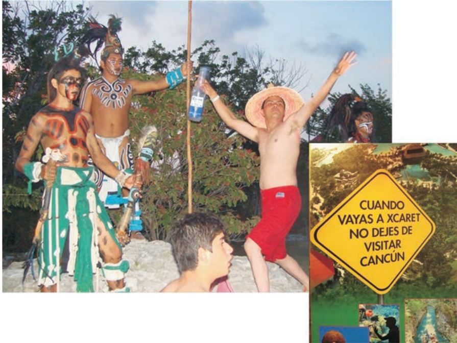
FIGURA 27. Imagen y anuncio de Xcaret

banaliza un verdadero sitio arqueológico usando a las pirámides como mero soporte para que la gente se tome fotos con personajes espectacularmente disfrazados de sacerdotes y guerreros mayas; y distorsiona actividades como presentar el juego de pelota de fuego purepecha como maya (porque es más espectacular), y narrar una versión bastante sesgada —incluso racista— de la historia mexicana en su espectáculo nocturno (figura 28).