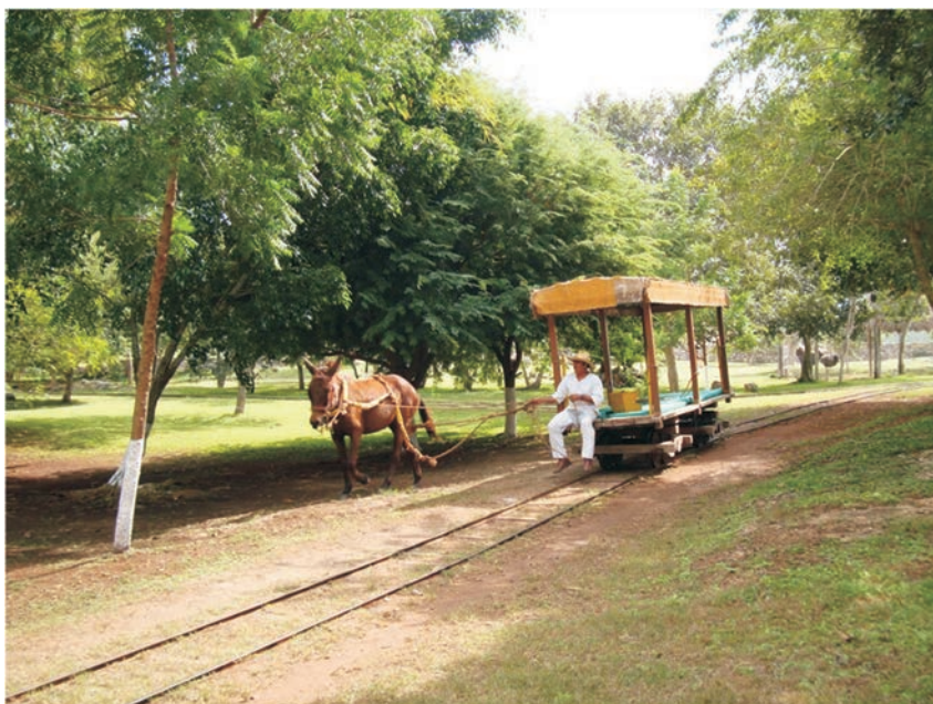
FIGURA 17. Truck en la hacienda de Sotuta de Peón