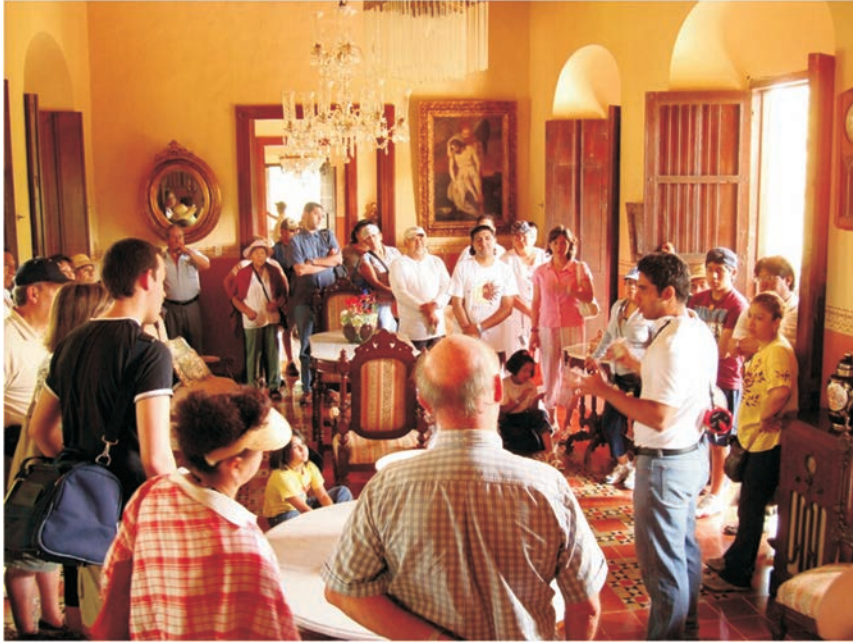
FIGURA 15. Explicación de un guía en la hacienda de Sotuta de Peón

hasta las modernas máquinas industriales de los últimos tiempos, donde ahora se produce material para artesanías turísticas. En el taller conoce uno al último mecánico sobreviviente de los tiempos de producción industrial, con quien uno puede platicar y tomarse fotos (figura 16).