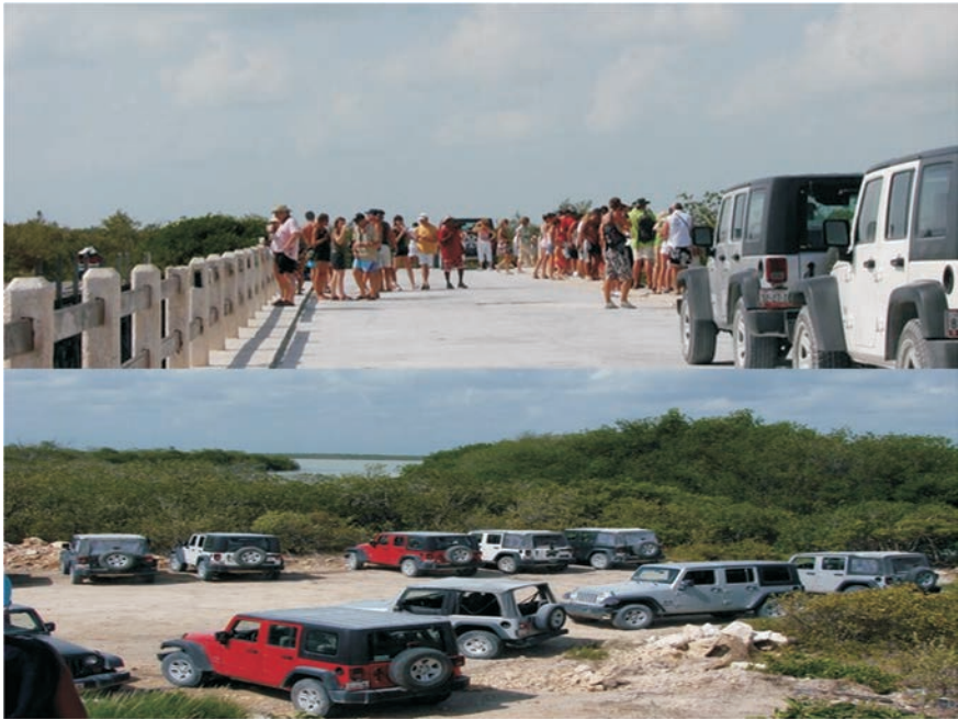
FIGURA 12. Camino hacia la reserva Si'an Ka'an