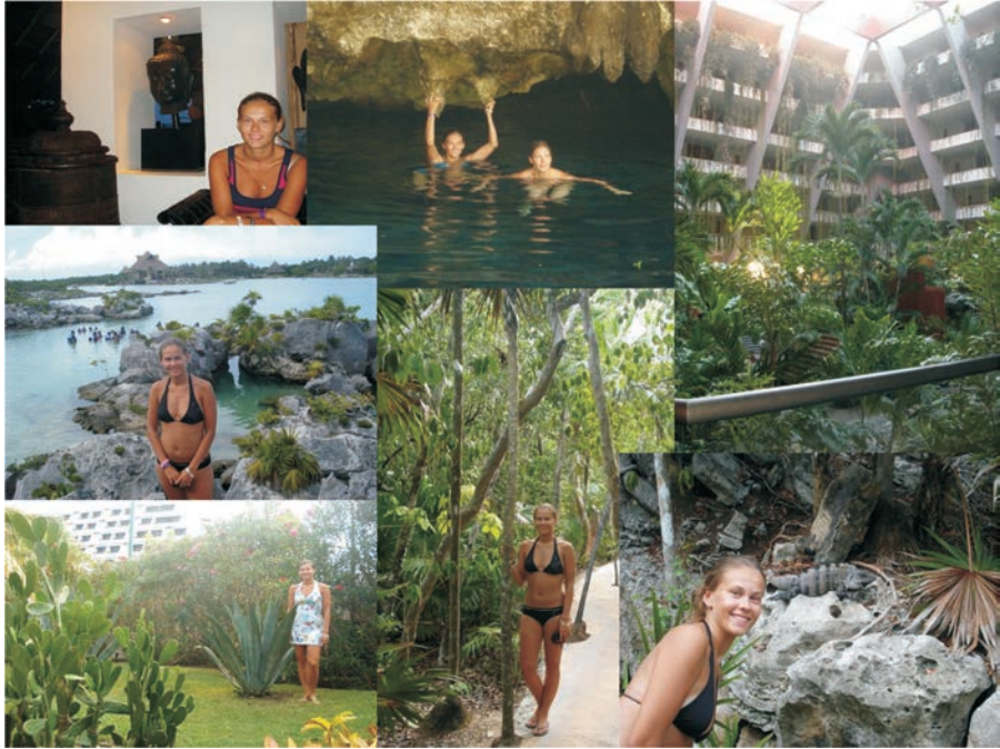
FIGURA 3. Fotografías realizadas por una turista lituana en la Riviera Maya. Tomadas con su autorización de su página de Facebook

la sucesión ecológica, hacia lugares más primordiales y primitivos en contraste con el posmodernismo del embarcadero (figuras 4, 5 y 6).