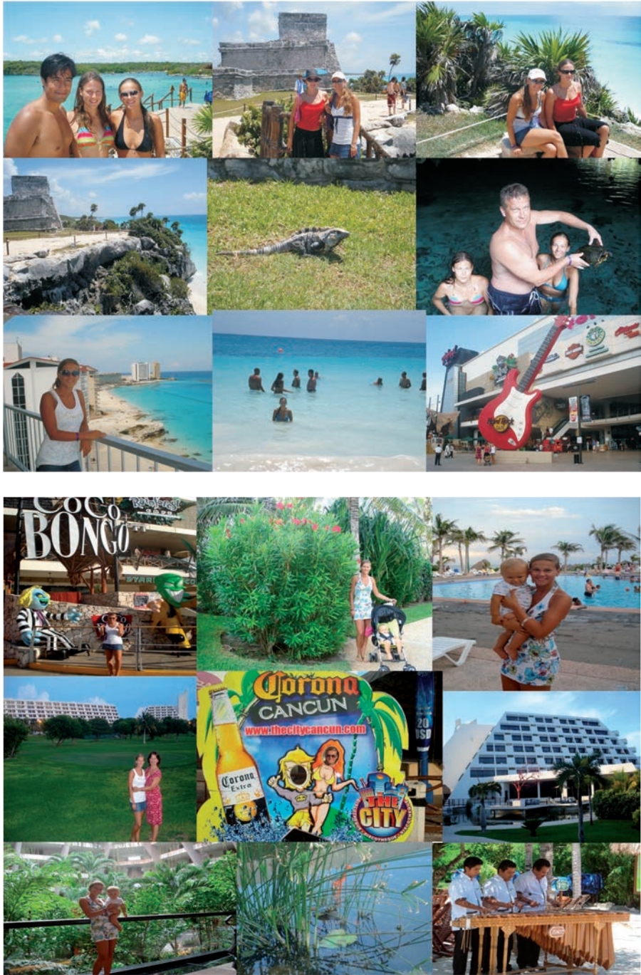
FIGURAS 1 y 2. Fotografías realizadas por una turista lituana en la Riviera Maya. Tomadas con su autorización de su página de Facebook