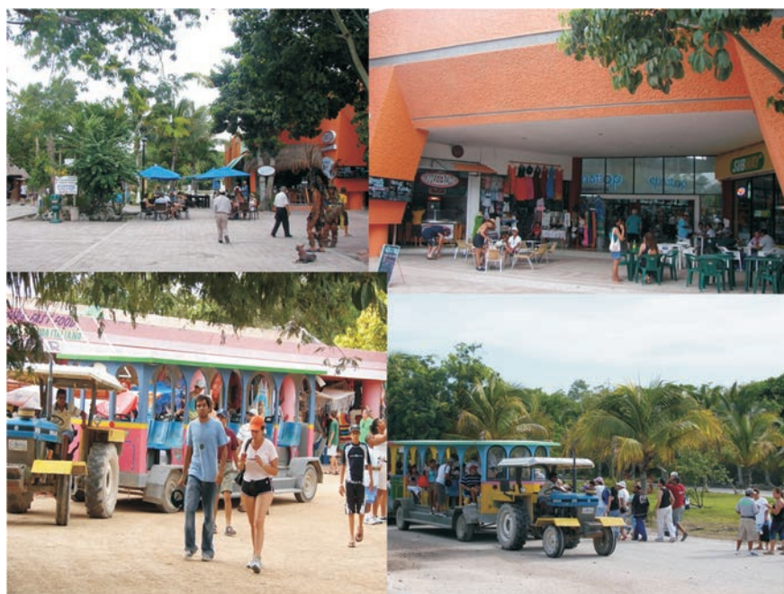
FIGURA 23. Entrada a Calakmul