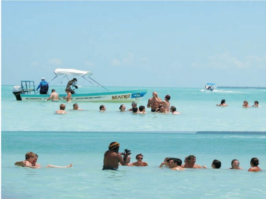
FIGURA 11. Imagen de El Blanquiazul