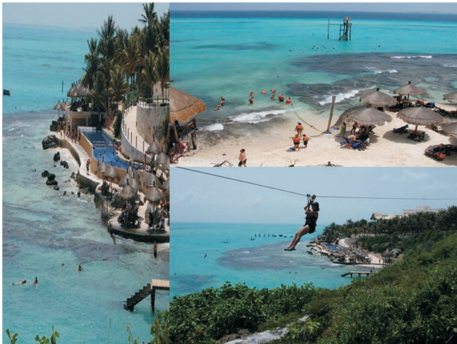
FIGURA 24. Imágenes de Xel-ha