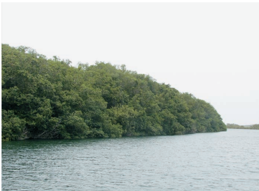
FIGURAS 4 y 5. Imágenes de río Hondo