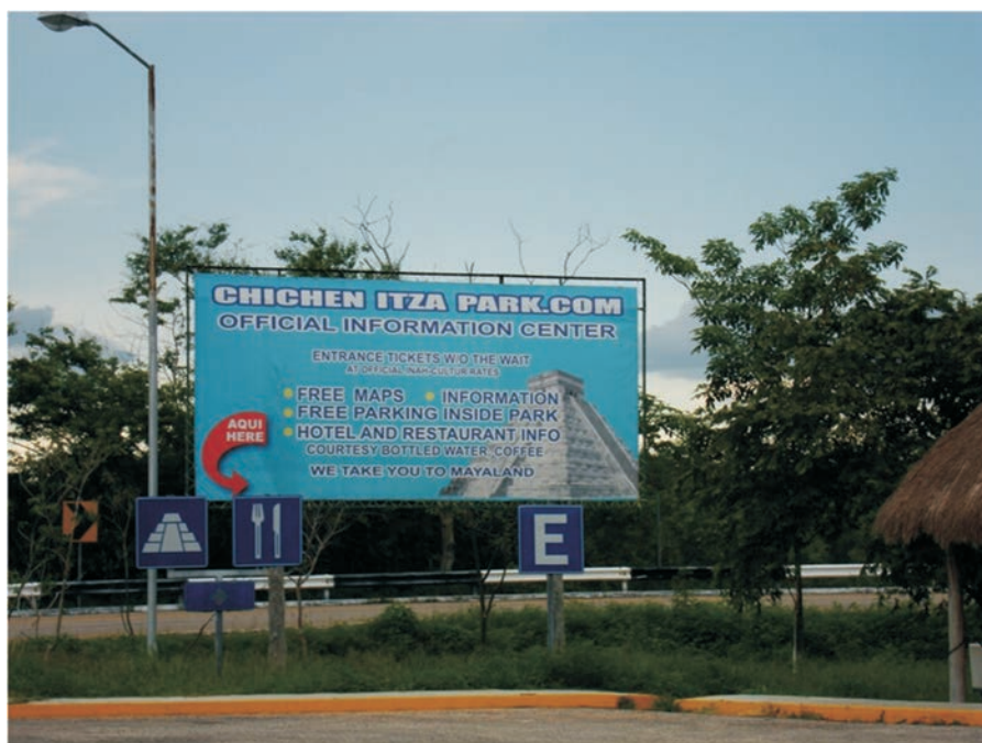
FIGURA 21. Anuncio de servicios turísticos

Pero el peor caso de estas concesiones de recursos naturales son las playas y arrecifes de El Garrafón y la caleta de Xel-ha a la misma compañía dueña de Xcaret. En el primer caso la compañía sólo agregó infraestructura para practicar algunos deportes y la típica tirolesa que identifica al ecoturismo de aventura para cobrar 50 dólares de entrada. Y en Xel-ha volaron con explosivos la más