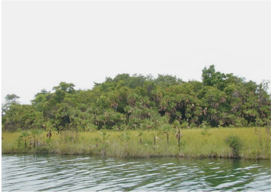
FIGURA 6. Imagen de río Hondo