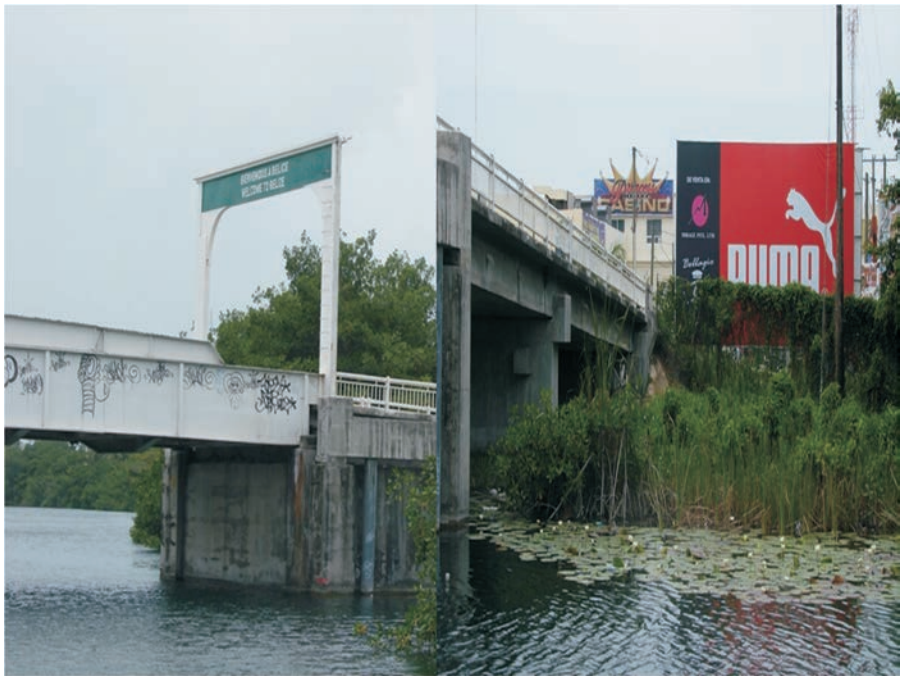
FIGURA 7. Frontera entre México y Belice