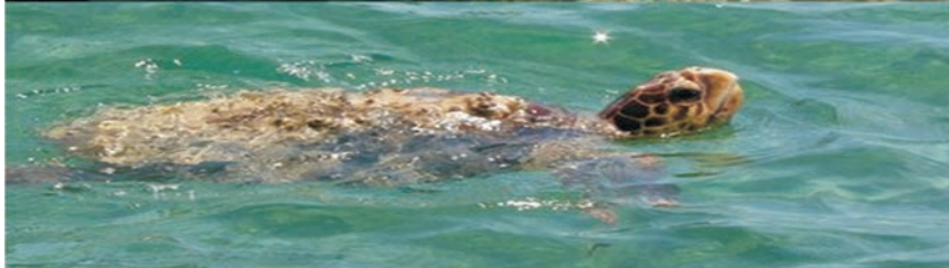
FIGURAS 9 y 10. Imágenes de El Blanquiazul