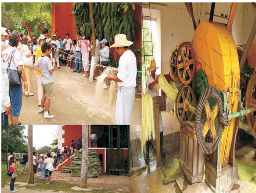
FIGURA 16. Taller de producción de fibra de henequén en la hacienda de Sotuta de Peón