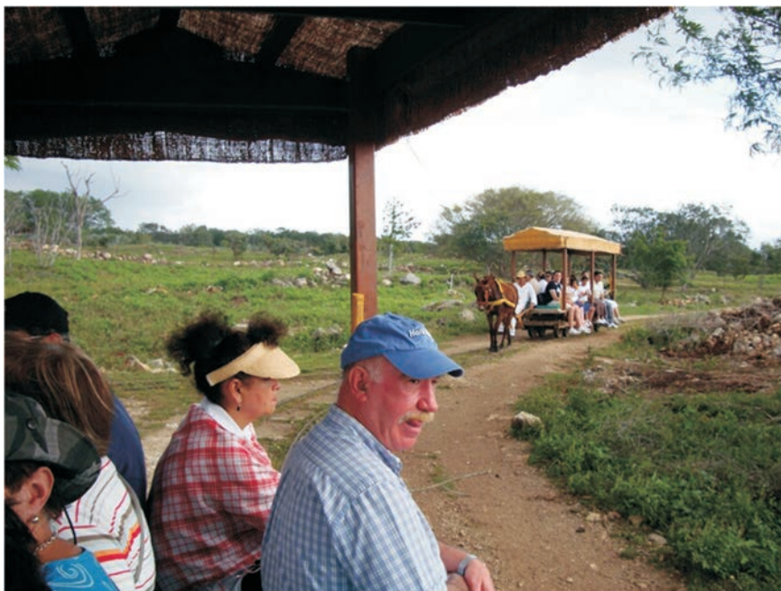
FIGURA 18. Paseo en truck por la hacienda de Sotuta de Peón