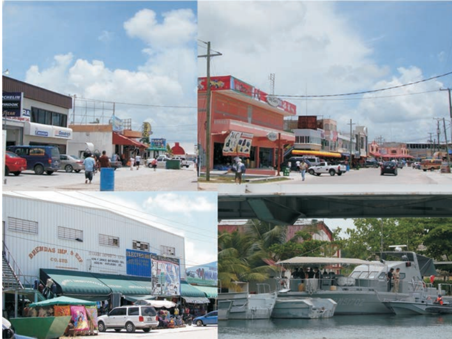
FIGURA 8. Zona libre de Belice

o menos 30 hoteles todo incluido, cuyo mapa actual reproduce la visión que en los años 70 tenía un atlas de zonas arqueológicas en la misma zona.