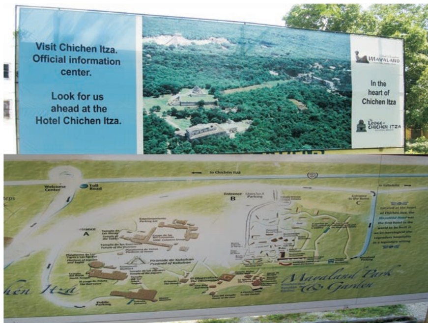
FIGURA 22. Mapa de la zona arqueológica de Chichén Itzá donde se muestra un par de hoteles