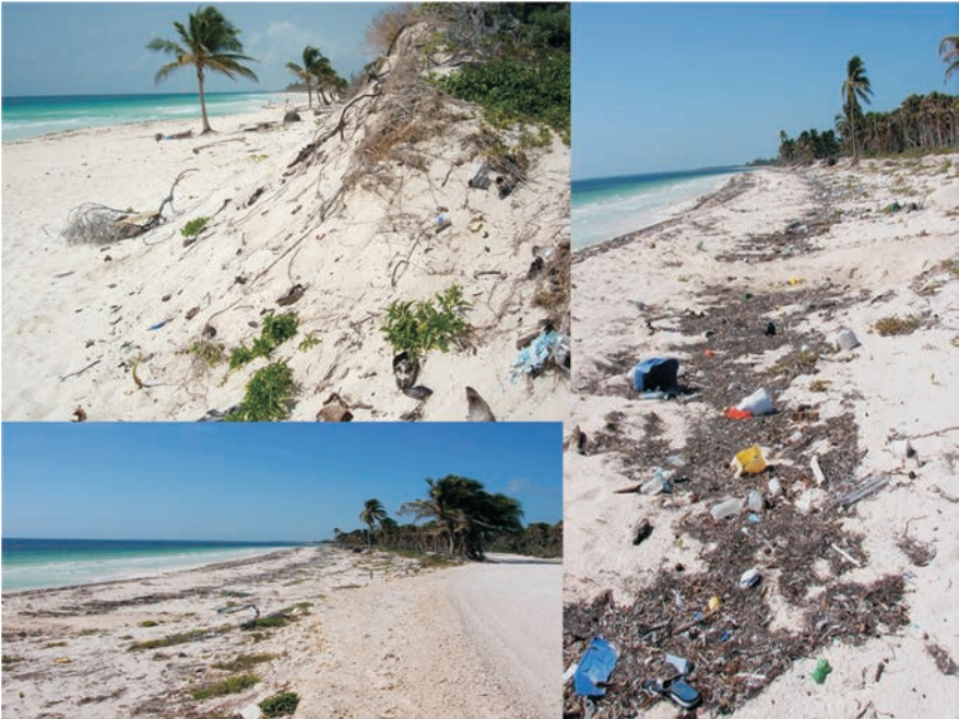
FIGURAS 13 y 14. Entradas vía terrestre a El Blanquiazul