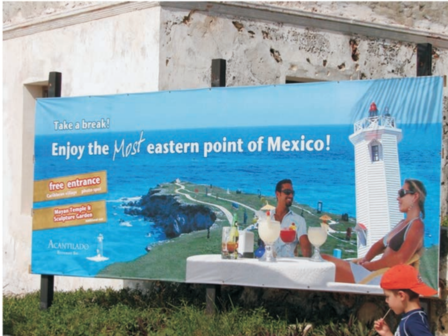
FIGURA 25. Anuncio de Isla Mujeres