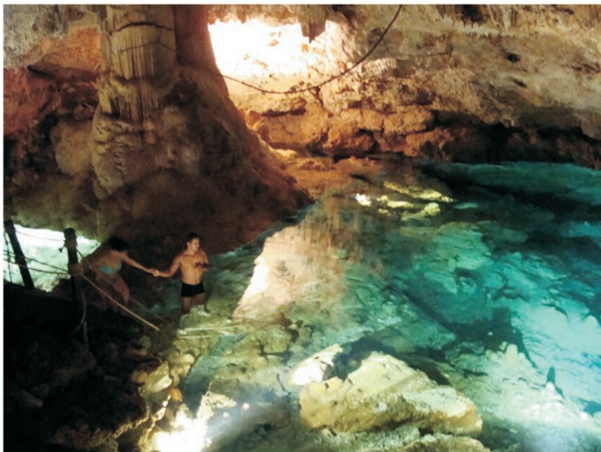
FIGURA 20. Cenote en la hacienda de Sotuta de Peón

maya funciona, de hecho, sobre la dinámica de la evocación de un pasado fuertemente imaginario que la arqueología se ha esforzado en definir; y la reconfiguración actual de estos espacios se hace proyectando los discursos de los imaginarios construidos a partir de las maneras de evocar.