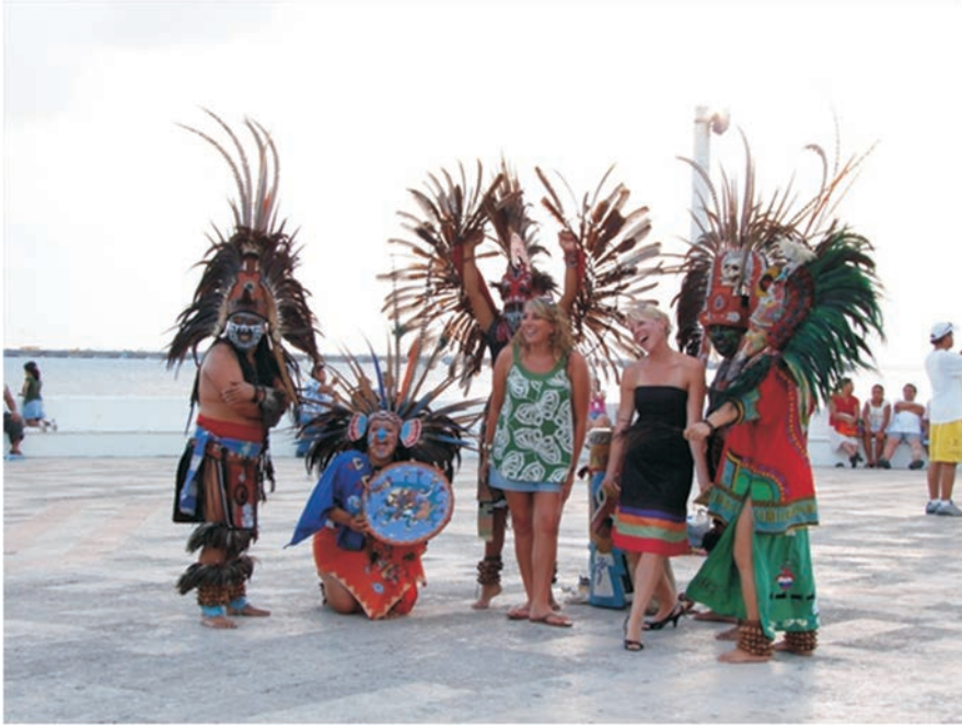
FIGURA 30. Turistas acompañadas por personajes con trajes autóctonos

una actividad rentable. En este sentido un hotel de diseño minimalista, un hotel boutique, tiene el mismo valor que una pirámide; y al mismo tiempo se justifica destruir o cortar una pirámide, si esta no es tan icónica como el Castillo de Chichén Itzá. Esto le ocurrió a varios templos de Xel-ha que tuvieron que competir contra la ampliación de la carretera de la Riviera Maya.