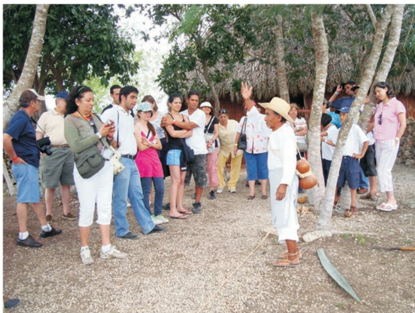
FIGURA 19. Descripción de una casa y un patio tradicionales por parte de un indígena maya a los turistas en la hacienda de Sotuta de Peón